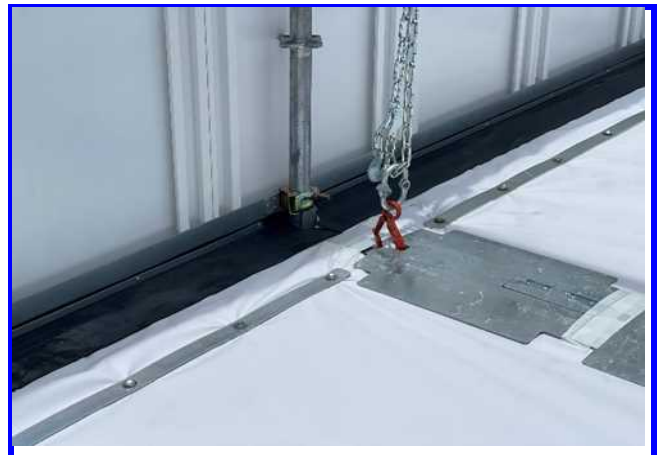
すきまレール・すきまプレート・パネル押さえ板