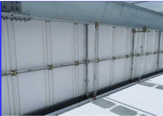
防護柵専用クランプ止め