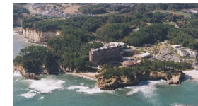
<伊師浜国民休養地(鵜の岬)> <大洗マリンタワー>