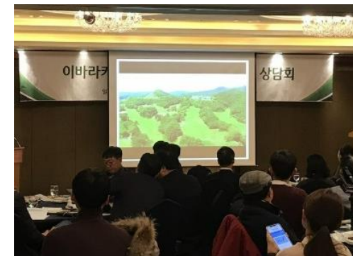
韓国でのゴルフセミナー