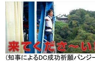
(知事によるDC成功祈願ハンジ)

※デスティネーションキャンペーン JRグループ6社と地域が一体となり、集中的な誘客プロモーションを全国で展開する国内最大規模の観光キャンペーン。