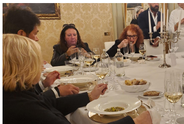
本県食材を使用したイタリア料理試食会の様子