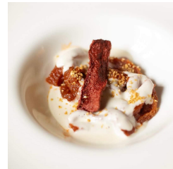
凍みこんにやく等を使った一品