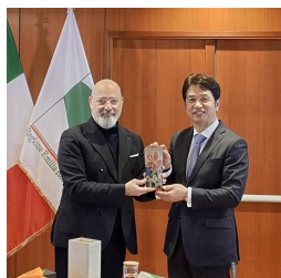
ボナッチーニ州知事を表敬訪問