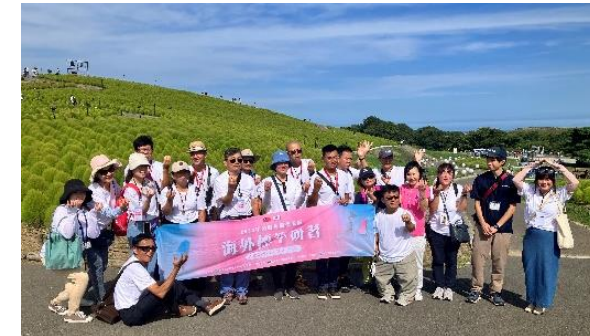
現地旅行会社の県内視察ツアー