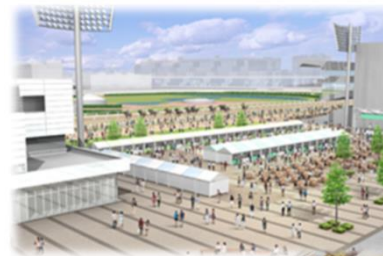
◀ウマイルスクエア