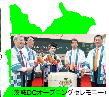
(茨城DCオープニングセレモニー)