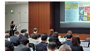
(エージェント説明会)