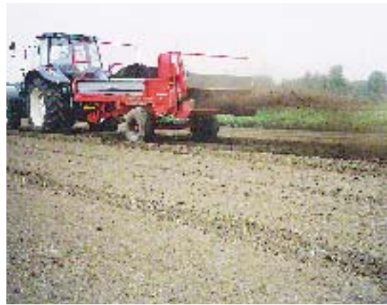
圃場に堆肥をまく様子

知事 建設費は、合併後の新市が合併特例債を発行し、残りは県の補助金と誘致期成同盟を構成する市町村の負担金で賄う。運営は済生会が建物と設備