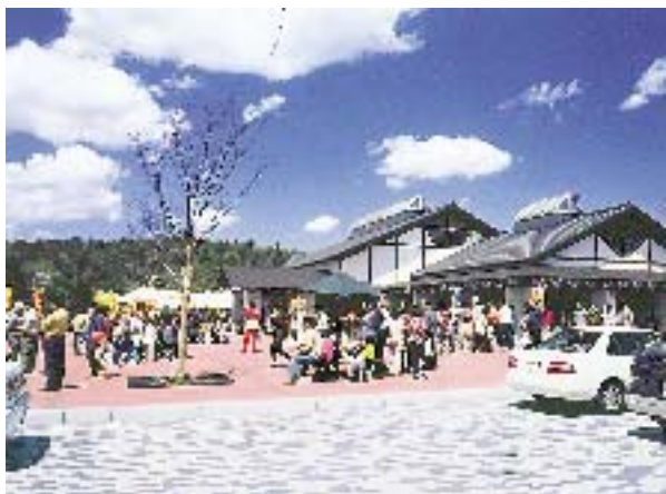
県北山間部農業活性化の拠点となる農産物直売所

農林水産部長 組織づくりや四季にわたる品揃えの充実等地域の主体的な取り組みを積極的に支援し、直売所を中心とした産地づくりを進め、県北山間地域の農業振興を図る。