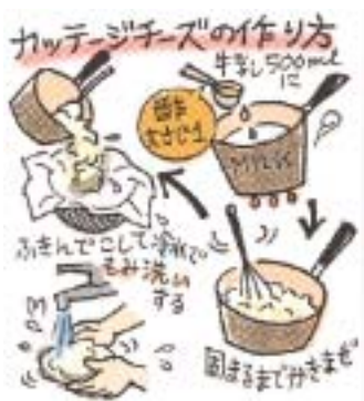
ナチュラルチーズの作り方

ふきんごと冷水にさらしながらも洗いして酢の匂いを消せばできあがりです。クラッカーや薄く切ったパゲットにのせてカナッペにしようゆを使った和風ドレッシングもよく合います。うのでサラダなどにもどうぞ。