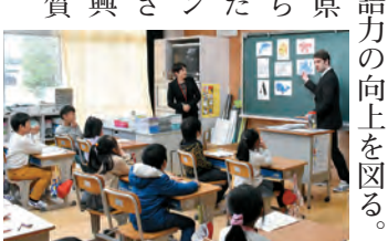
小学校におけるALTを活用した授業の様子

教育長 A L T ※を増員し、授業以外でも生徒がA L Tと英語で触れ合う機会を設定している。また、中学校ではタブレットを活用したスピーキングチェックを行うなどにより、英語力の向上を図る。(ほかに、県西地域のさらなる発展のための交通インフラ整備、さしま茶の振興方策なども質問)