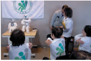
ロボット実証実験の様子

商工労働観光部長 コンクールを開催し、観光資源の発掘および周遊ルートの策定を図るほか、りんりんロードなどを活用した宿泊・体験型ツアーの造成を支援していく。また、着付けや果物狩りなどを活用し、外国人の誘客を図る。(ほかに、常磐道スマートIC設置への支援、小中学校における歴史教育なども質問)