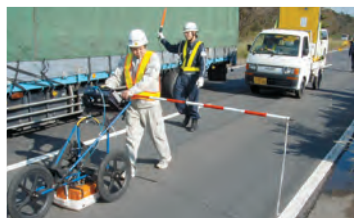
空洞探査機による調査の様子

土木部長 地下構造物の老朽化が進む箇所や土砂流出が起りやすい地盤特性を有する区間などにおいて、空洞探査機による調査も必要と考えており、試験的な調査ができる限り早く実施できるように、検討を進めていく。(ほかに、アレルギー疾患対策、犬猫殺処分ゼロに向けた取り組みなども質問)