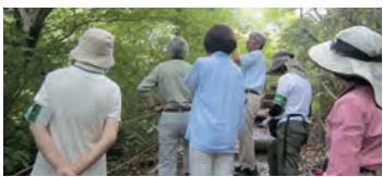
筑波山における紫峰杉ショートガイドの様子

農林水産部長 民間団体などとの連携については、他県の状況も参考に検討していきたい。また、森林湖沼環境税の適切な活用についても積極的な検討を行い、山の日の普及推進に取り組んでいく。(ほかに、通学用ヘルメットの普及推進、ヤード条例なども質問)