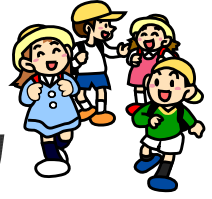
小中高生の関係する交通事故発生状況