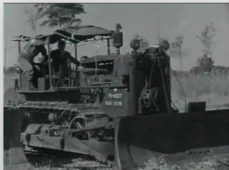
自衛隊のブルドーザー