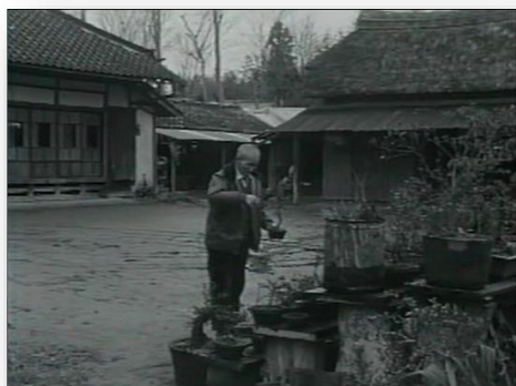
関城町の一般家庭