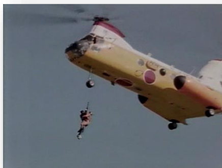
ヘリコプターによる救助訓練