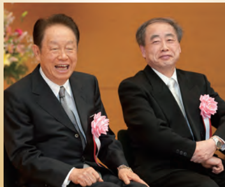
江崎玲於奈氏(左)と小林誠氏(右)