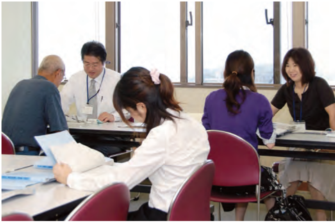
就職支援体制の充実を図ります

さらに、雇用・研修一体型事業をはじめとする雇用対策を実施し、市町村が実施する事業分も含め、二千