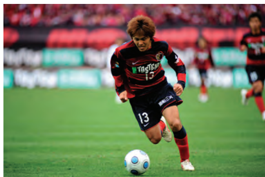
※時間はすべて試合開始の時間です。