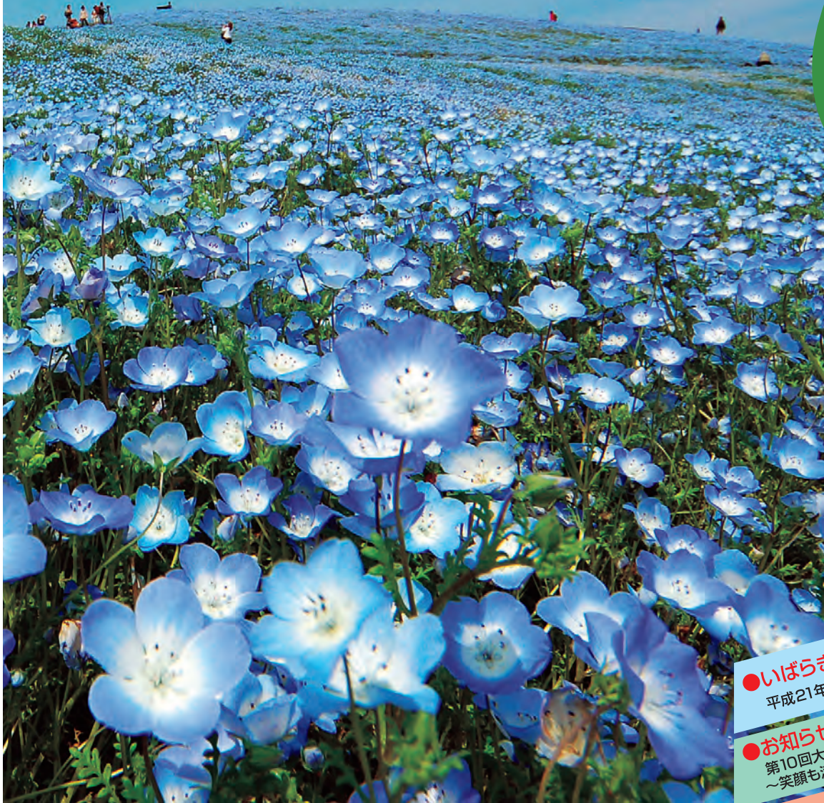
4月下旬から咲き始めるネモフィラ (ひたちなか市)

4月号 平成21年4月1日 発行人 茨城県広報広聴課 〒310-8555 水戸市笠原町978番6 TEL 029-301-2128 FAX 029-301-2168 TEL 029-301-1111(代表)