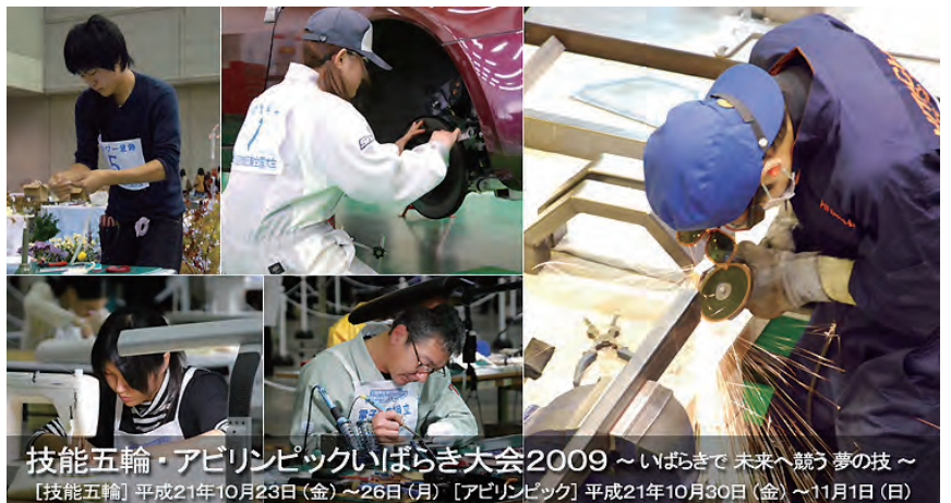
技能五輪・アビリンピックいばらき大会2009～いばらきで未来へ競う夢の技～ 【技能五輪】平成21年10月23日(金)～26日(月) 【アビリンピック】平成21年10月30日(金)～11月1日(日)