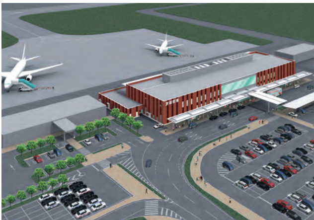
首都圏第3の空港である茨城空港 (イメージ図)

昨年十二月に北関東自動車道の県内全区間が開通するとともに、三月には、首都圏中央連絡自動車道も稲敷インターチェンジまで開通いたしました。また、茨城空港については、韓国のアジアナ航空から、来年三月の開港時にソウル(仁川)便を一日一便就航させるとともに、開港数カ月後に、週三便程度の釜山便の運航も計画しているとの表明がありました。引き続き積極的なPR活動を行い、首都圏第三の空港である茨城空港のさらなる就航路線の確保に努めます。