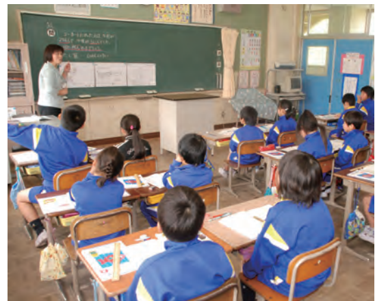
基礎的な計算力の定着を図ります