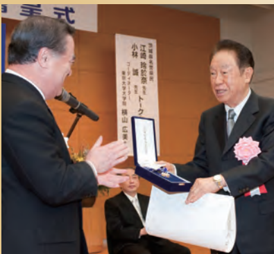
江崎玲於奈氏(右)に名誉県民章を贈呈

その中で、江崎氏から「輝かしい将来は受動的に来るものではない。自分自身の努力によって勝ち取る、つかみ取るもの」、小林氏から「成果は後からついてくる。努力により誰にでも大きなチャンスが訪れる。大いに科学にチャレンジしてほしい」とのメッセージが参加した高校生たちに送られました。