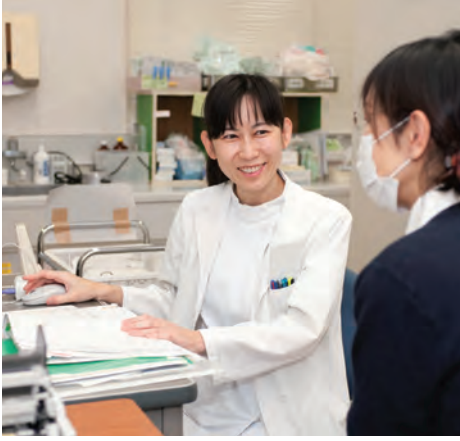
医師確保に取り組んでいます

開始します。 さらに、分娩取扱手当や救急勤務医手当を支給する医療機関に助成を行います。 次に、少子化対策については、妊婦が十四回の健康診査を受けられるよう、市町村に助成するとともに、中小企業における定員十人未満の事業所内託児施設等の整備を促進します。 また、周産期医療については、妊産婦や新生児の救急時に受け入れ先を調整するコーディネーターの配置を促進するとともに、医療機関が院内助産所や助産師外来を開設する場合に助成を行います。 高齢者対策については、「第四期いばらき高齢者プラン二十一」に基づき、認知症対策や高齢者の権利擁護の推進などに取り組んでいきます。また、福祉・介護職員の人材確保に努めます。 霞ヶ浦等の湖沼・河川の水質浄化については、森林湖沼環境税を活用して下水道や農業集落排水施設への接続補