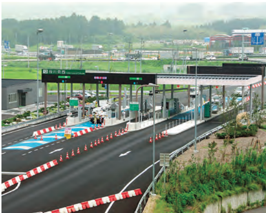
茨城・栃木・群馬を結ぶ北関東道（桜川筑西IC）

さらに、県北・県央十三市町村を区域とする「水戸ひたち観光圏」について、北関東自動車道の県内全区間開通などを踏まえ、また、茨城空港の開港も見据え、魅力ある観光圏づくりを進めていきます。