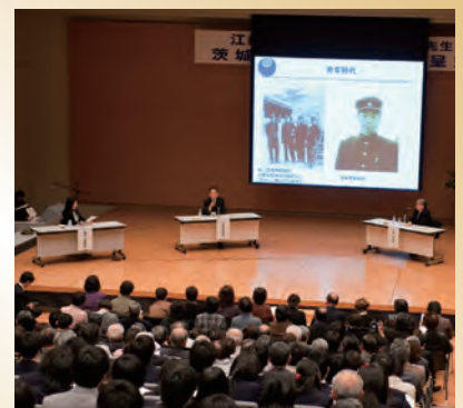
トークセッションの様子