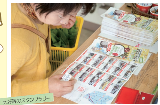
大好評のスタンプラリー

県北地域スタンプラリーを実施している28カ所の直売所を訪れ、それぞれが出しているクイズに答え、スタンプを3つまたは5つ集めて応募すると、抽選でシタケ、お米、ジェラートなど直売所の自慢の県産品が当たります。