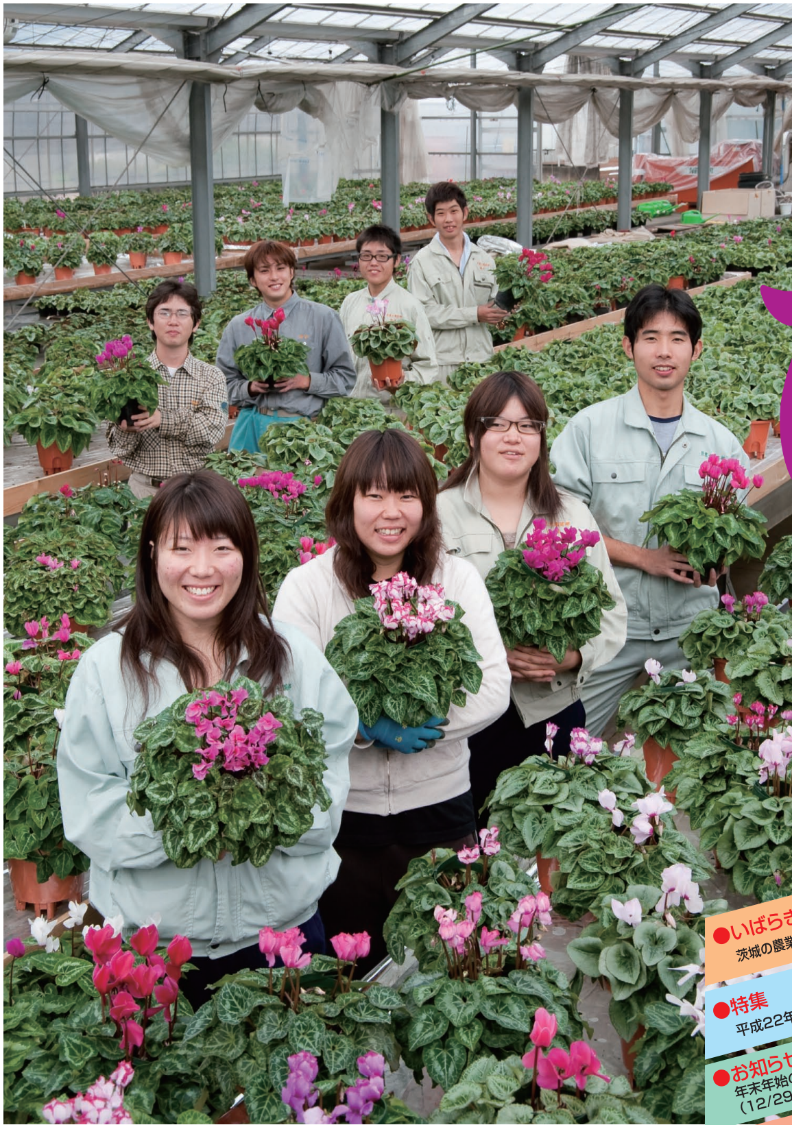
シクラメンを手にする学生たち・岩井キャンパス(坂東市)