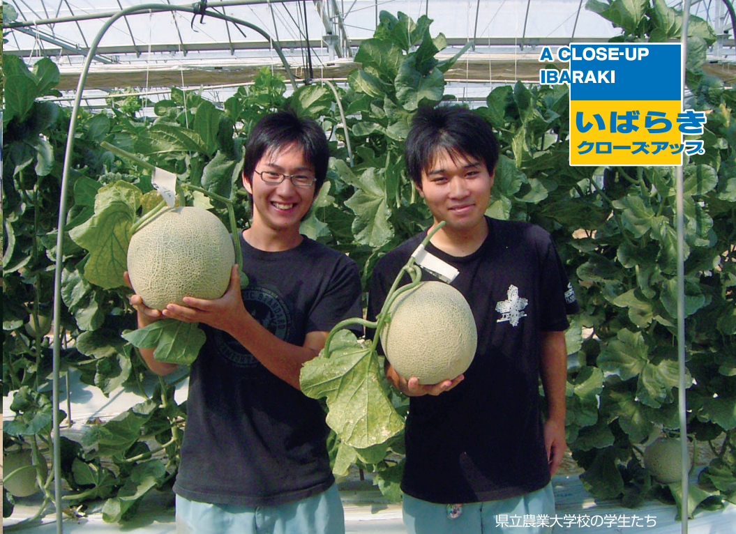
県立農業大学校の学生たち