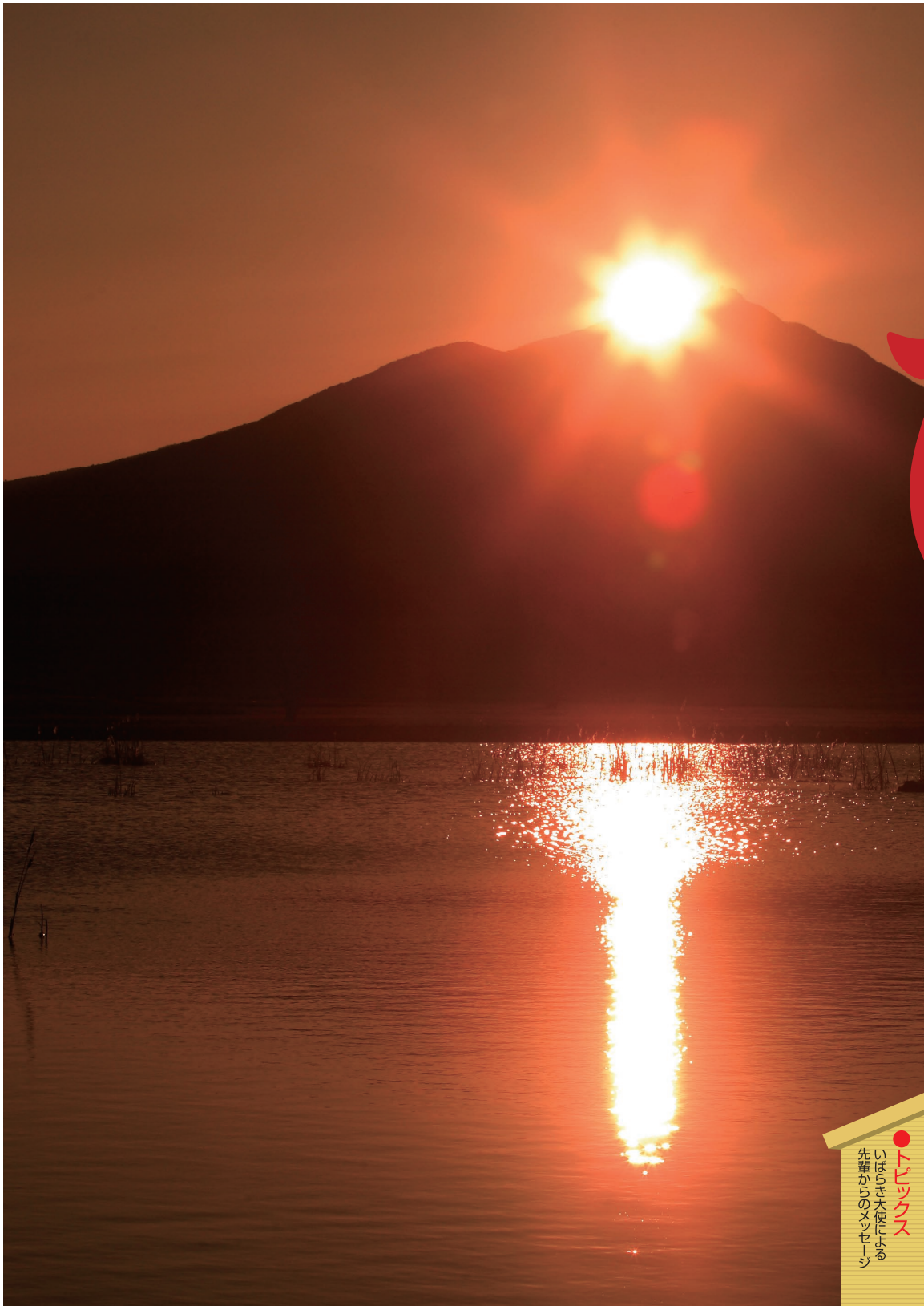
筑波山の日の出(筑西市)

あけましておめでとうございます。 昨年は、厳しい経済・雇用情勢の中、本県発展のための重要な拠点である茨城空港が開港しました。本年も、徹底した行財政改革に努めながら、北関東の全線開通などを踏まえて活力ある県づくりを更に進めますとともに、「生活大県」の実現に向けまい進してまいります。 まず、地域医療の充実や少子化対策、高齢者の健康・生きがいづくり、障害者の自立支援に力を入れますとともに、地球温暖化対策や霞ヶ浦の水質浄化などに積極的に取り組んでまいります。また、「人づくり」のため、理数教育の充実や子どもたちの豊かな心の育成に力を入れてまいります。さらに、本県の更なる発展と雇用の場の確保を図るため、広域交通ネットワークの整備や企業誘致、中小企業の振興、儲かる農業の実現、観光の振興などに一層力を入れてまいります。 最後に、この一年の皆様のご健勝とご多幸を心からお祈り申し上げます。