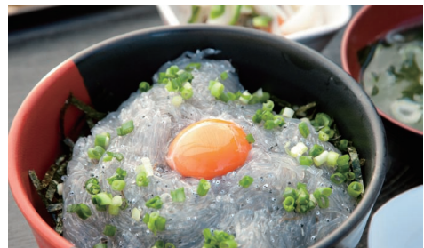
生シラス丼は驚きのボリュームと鮮度!

生食用凍結シラスを提供している店の一つが、大洗町漁協直営「かあちゃんのお店」。市場で水揚げしたての新鮮な地魚が食べられると大人気の在庫が切れてしまうことも。メニューは季節ごとに変わるため、お問い合わせの上、おでかけください。