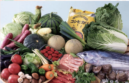
茨城の農林水産物