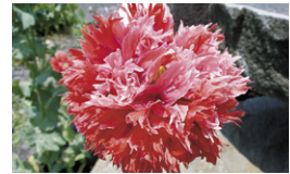
ソムニフェルム種 (ケシ)

法律で禁止されていることを知らずに、不正栽培していることがあります。疑わしい植物を見つけたら、お近くの保健所までご連絡ください。