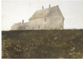
「霧の中のオルソンの家」1967年

丸沼芸術の森コレクションの核をなすアメリカの画家アンドリュー・ワイエス(1917-2009)の水彩画・素描を中心に、丸沼芸術の森アトリエ所属の作家たちの作品を紹介します。