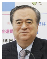
茨城県知事 橋本 昌

峰は険しく 山は高し・多珂郡 常陸国風土記に登場する多珂郡は、北茨城市、高萩市、日立市の一部、常陸太田市の一部からなっているとされています。 多珂(たかの)国造建御狭日命(たかのくにのくにのみこと)が初めてこの地を訪れたとき、峰は険しく山は高いことから、多珂(高)と名付けたと常陸国風土記には書かれています。 高萩市では、5月3日(金)～4日(土)にかけて、常陸国風土記勅撰1300年記念祭「日本ふしぎ発見!まほろばの旅」と題した記念祭やコンサートが開催されます。 新緑も美しいこの季節に、花貫溪谷など多珂郡と呼ばれた地域に、ぜひ、お出かけになってみませんか。