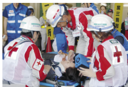
迅速な活動のために—災害救護訓練