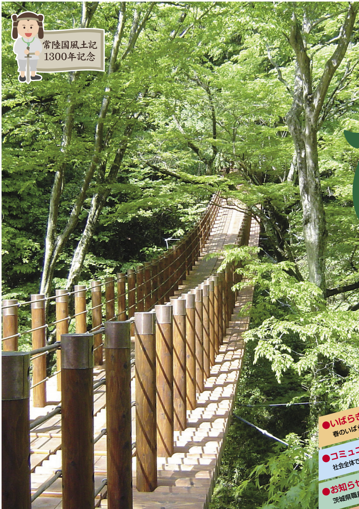
花貫溪谷(高萩市) 高萩市まちづくり観光課 ☎0293(23)7316