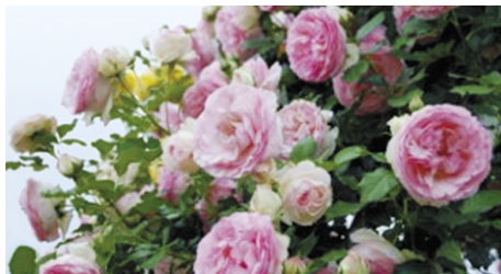
「バラまつり」は5月25日(土)~6月23日(日)

ゴールデンウィーク中は楽しいイベントが盛りだくさん! 美しい花に囲まれた1日をご家族で過ごしませんか。朝日トンネルの開通でアクセスも便利になりました。5月5日(日)こどもの日は、小・中学生の入園無料!