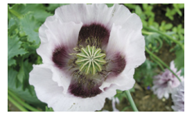
セティゲルム種 (アツミゲシ)