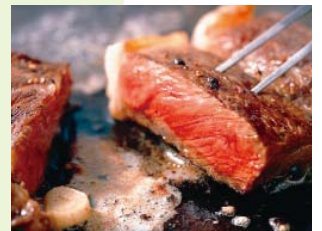
ジューシーな常陸牛ステーキ