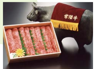
しゃぶしゃぶ用霜降り肉