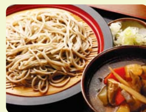
つけけんちん(郷土料理)