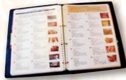
分厚いファイルは従業員の手作り

茨城県に暮らし、その良さを十分に知り尽くした地元の人から歓迎されるホテルがここにありました。