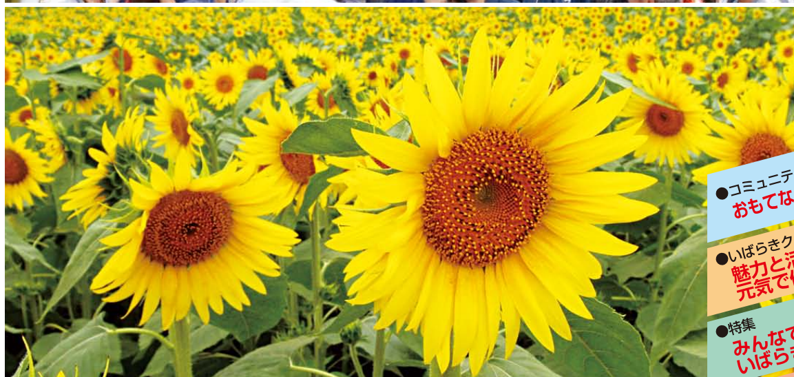
古河花火大会(古河市)、水戸黄門まつり(水戸市)、なかひまわりフェスティバル(那珂市)