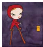
奈良美智 「長い長い夜」 1995年 ©Yoshitomo Nara

水戸市千波町東久保666の1 ☎029(243)5111 FAX9992 (入館料)一般980円、高・大生720円、小・中生360円