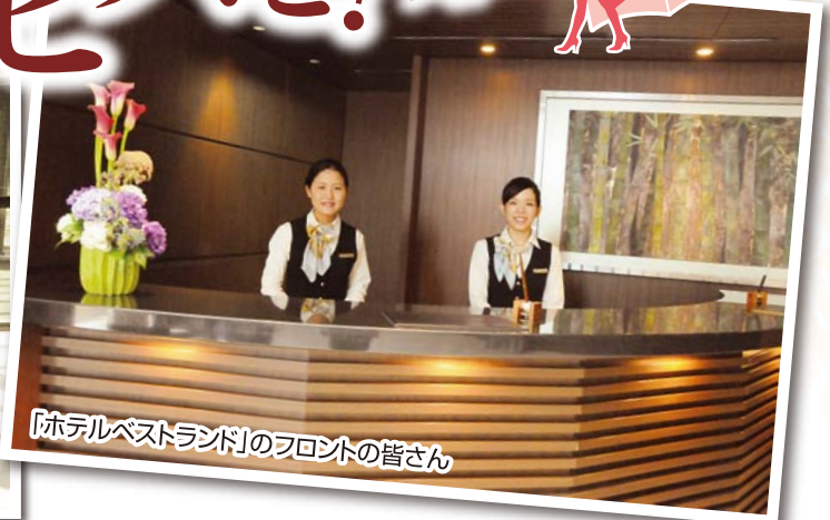
「ホテルベストランド」のフロントの皆さん

東日本大震災や福島第一原子力発電所事故による風評被害で、本県の観光産業に大きな影響が出ています。平成31年に茨城国体、平成32年に東京オリンピック・パラリンピックを控え、県では「おもてなし」を向上させることで観光地の満足度向上やリピーターの確保を図ろうと、「おもてなしレベルアップ事業」を実施しています。今回は、その取り組みを紹介します。