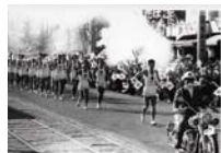
東京オリンピック聖火リレー 水戸市南町(昭和39年)

東京オリンピックから50年、茨城国体から40年を記念して、本県のスポーツの歩みを紹介します。