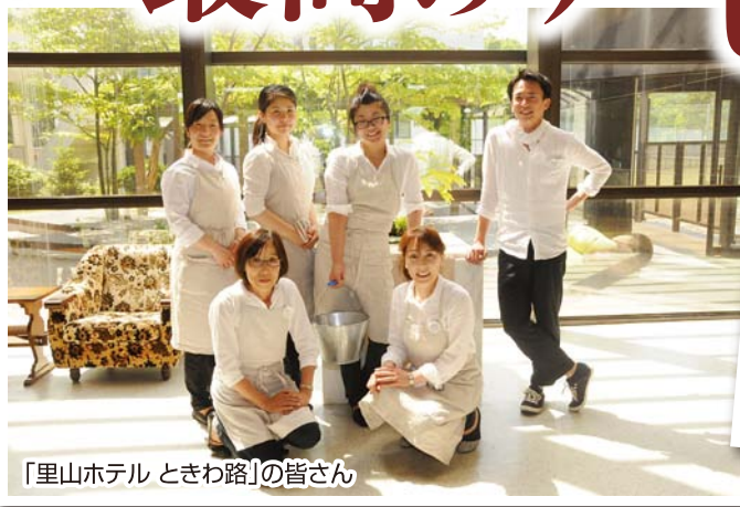
「里山ホテル ときわ路」の皆さん