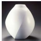
前田昭博 「白瓷面取壺」 2010年

25年度に新たに当館のコレクションに加わった人間国宝・前田昭博の「白瓷面取壺」をはじめとする作品19点を紹介します。 笠間市笠間2345(笠間芸術の森公園内) ☎0296(70)0011 FAX0012 (入館料)一般310円、高・大生260円、小・中生150円