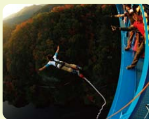
バンジージャンプ

このような地域ならではの魅力を多くの方に伝えるため、アウトドアスポーツの紹介や体験談などを投稿できるホームページ( http://ibaraki-outdoor.jp )を開設します。県北地域のアウトドアの魅力を一緒に発信していきませんか。