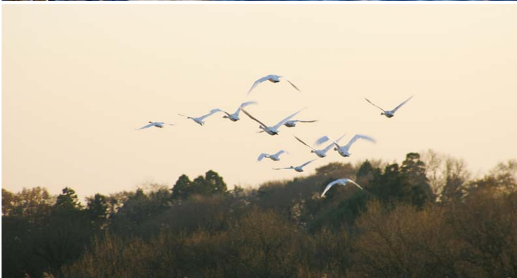
菅生沼(常総市・坂東市) 常総市観光物産協会 ☎0297(23)9088 坂東市観光協会 ☎0297(20)8666