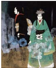
みよこ 菊川三織子 「静韻」2001年

北茨城市大津町椿2083 ☎0293(46)5311 ㊟5711 (入館料)一般190円、高・大生110円、小・中生80円