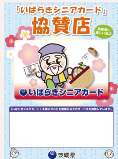
協賛店舗のステッカー

協賛店舗には、特典内容を記載したステッカーが掲示されています。目印にしてください。