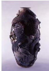
うきゆれんぶつしらすきかかせみまかひん 初代宮川香山「浮彫蓮子白鷺翡翠図花瓶」 明治時代前期 岐阜県現代陶芸美術館蔵

国内の陶芸専門の美術館で構成する、陶磁ネットワーク会議加盟8館の自慢の作品を含めたコレクションを展示し、焼き物とは何かを紹介します。