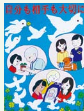
人権啓発キャラクター ココロちゃん