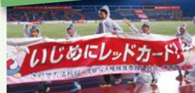
Jリーグと提携した活動