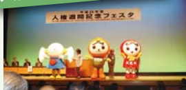
講演やミニコンサートの実施