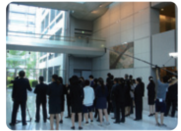
ドラマ「グラ・メ〜総理の料理番〜」のロケ現場（県議会議事堂）