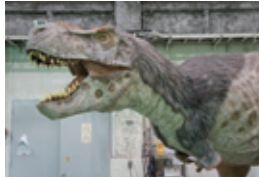
羽毛を生やした ティラノサウルス

第2展示室「恐竜たちの生活」コーナーの動く恐竜が、最新の研究成果を反映し、体の一部に羽毛を生やすなどして復元されます。