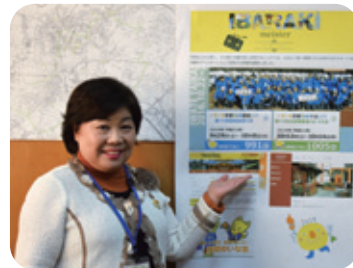
2年後の茨城国体でもおもてなしを 実践していきます

県民の皆さん一人一人が、自分も観光マイスターだということうな気持ちを持って、茨城の魅力を発信していただけたら良いなと思っています。