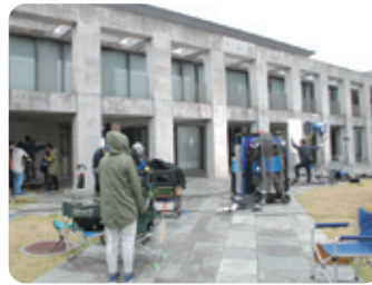
映画「疾風ロンド」のロケ現場（県庁）