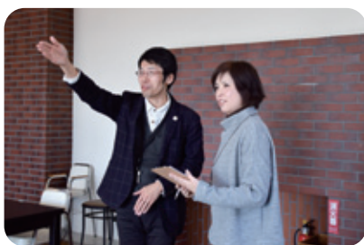
日々、おもてなしを実践しています

「おもてなし」を実践するためには、「コミュニケーション」が重要です。お客さまの話に耳を傾け、求めるものを積極的に知り、おもてなしを実践したら自分なりに振り返って改善する。これを繰り返すことで、自身も成長することができるのではないかと思います。