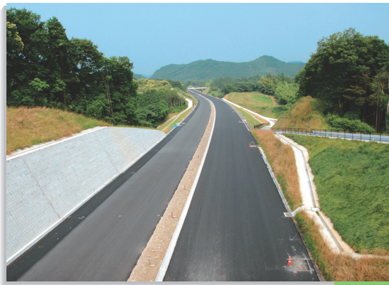
開通に向けて工事が進む北関東自動車道 友部IC～(仮)笠間IC