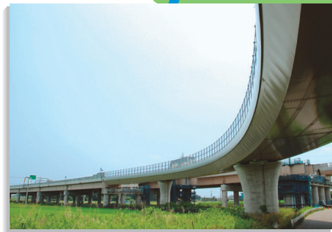
首都圏中央連絡自動車道の建設も順調です

茨城県の高速道路が、便利に快適に変わろうとしています。現在、三本の高速道路が建設中です。工事の進み具合や、さらに便利になるための取り組みなどをレポートします。