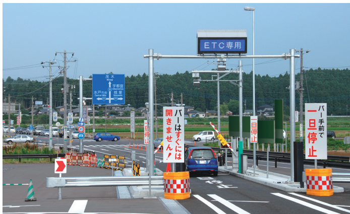
スマートICの設置により、常磐自動車道のアクセスが容易になりました

ETC専用であり、東京方面乗り降り限定という条件はありますが、高速道路の有効活用にもつながる画期的な試みです。すでに正式導入となっている友部S AスマートICと同様、早期の恒久化を期待したいと思います。