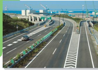
北関東自動車道は常陸那珂港と直結しています