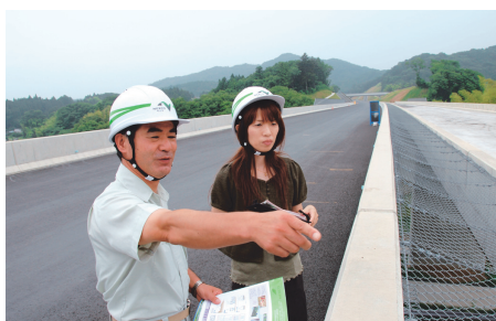
開通に向け、着実に工事が進められています