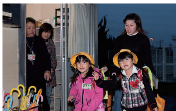
保護者と下校するので安全です

たちの元気な声が響き渡ってきました。二つの活動を連携させることにより、子どもたちの遊びの幅が広がり、ボランティアの人との交流が一層深まったそうです。「子どもたちの成長を見ることが何よりもうれしい」と言うプランマネージャーの方の温かいまなざしが、未来を担う子どもたちの心の支えになっていてると思えました。