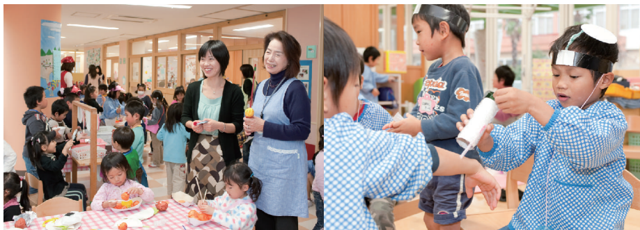
市内の幼稚園と保育所を統合してオープンした認定こども園えどさき

また、核家族化など、子育てをめぐる社会環境の大きな変化は、幼児教育・保育のニーズの多様化と親の子育てへの不安をもたらしめています。このような問題を解決するため、県では、「いばらき出会いサポートセンター」を中心とした結婚支援をはじめ、保育所の整備、放課後の子どもの居場所づくり、乳幼児の医療