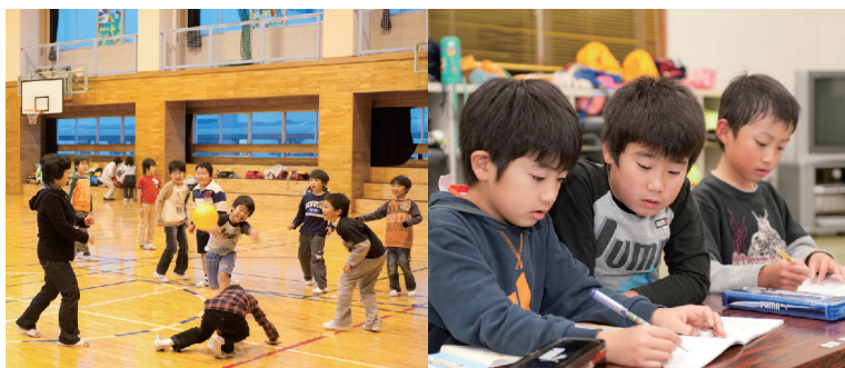
放課後子ども教室(左)と放課後児童クラブ(右)

費助成や子育て家庭優待制度(いばらきKids Clubカード)などといった子育てに関するさまざまな支援を行い、子どもを産み育てやすい環境の整備に努めています。