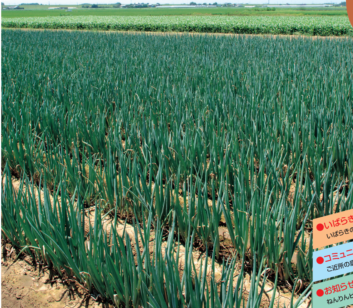
県の銘柄指定産地を受けている坂東市の夏ネギ畑

9月号 平成19年9月1日 発行人 茨城県広報広聴課 〒310-8555 水戸市笠原町978番6 TEL 029-301-2128 FAX 029-301-2168 TEL 029-301-1111(代表)