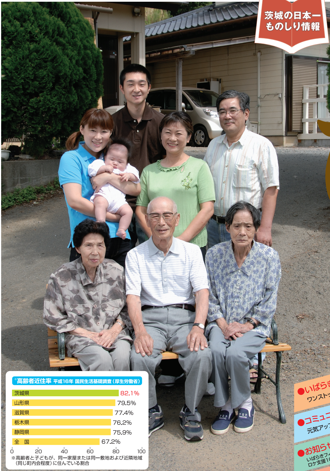
◆高齢者近住率 平成16年 国民生活基礎調査(厚生労働省)