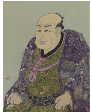
かたおかたまこ きたかわうたまる 片岡球子「喜多川歌麿」 昭和53(1978)年 国際交流基金蔵

■9月の休館日/2、9、17、24、30日 北茨城市大津町椿2083 ☎0293(46)5311 FAX0293(46)5711