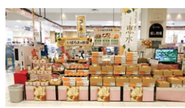
◀昨年度のスイーツフェスタの様子