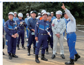
令和5年台風13号被災現場の防災担当大臣視察

9月は防災月間です。昨年は、本県において豪雨が相次ぎ、今年度に入っても全国各地で発生するなど、豪雨災害が頻発化・激甚化しています。また、1月に能登半島地震が発生したほか、先月には南海トラフ地震臨時情報(巨大地震注意)が初めて発表されました。私は、過去の災害を教訓とし、先手先手で防災・減災対策を進めることが重要と考えています。