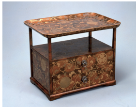
むらなしじけからくであいゆうさくもんちらしまきえはながみだい 叢梨子地竹唐草葵裏菊紋散時絵鼻紙台 (国指定重要文化財・県立歴史館蔵)

■9月の休館日/2、9、17、24、30日 水戸市緑町2-1-15 ☎029(225)4425 FAX029(228)4277