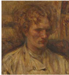
《エロシエンコ氏の像》1920年 東京国立近代美術館蔵 ※12/22~28はパネル展示

水戸市出身の洋画家・中村彝の代表作約120点が一堂に会する大回顧展。重要文化財《エロシエンコ氏の像》(12/22~28はパネル展示)をはじめ、彝が多大な影響を受けたオーギュスト・ルノワールの《泉による女》も展示されます。当館のみの単独開催となる本展を、どうぞお見逃しなく。