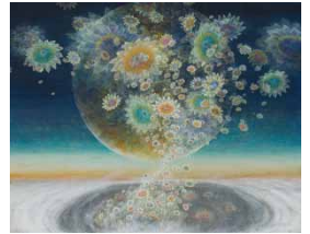
《月になる花》2015年(個人蔵)

北茨城市大津町椿2083 ☎0293(46)5311 ㊟0293(46)5711