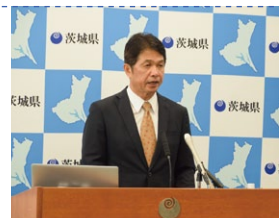
救急搬送における選定療養費の徴収について記者会見で説明しました(10月)

近年、救急搬送件数は増加傾向にあり、昨年、本県では14万件を超え、過去最多を更新しました。そのうち約半数を軽症患者が占め、中には緊急性の低いケースもあることから、重篤な救急患者を受け入れるという病院本来の役割が果たせなくなる事態も想定されます。