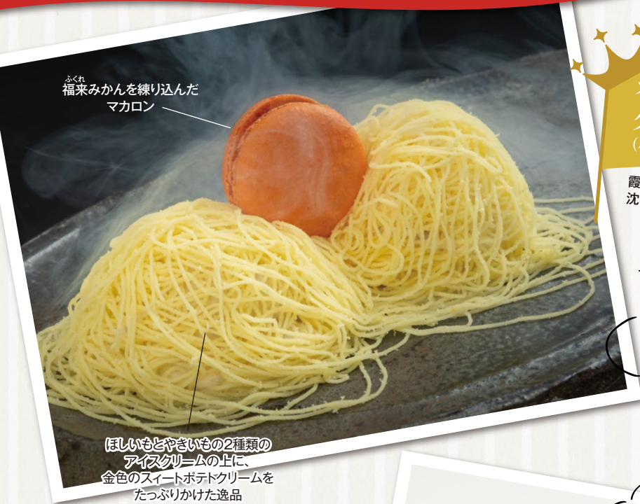
ふくれ 福来みかんを練り込んだ マカロン