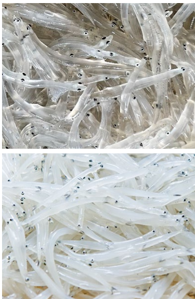
霞ヶ浦 暁のしらうお(上)と従来品(下)