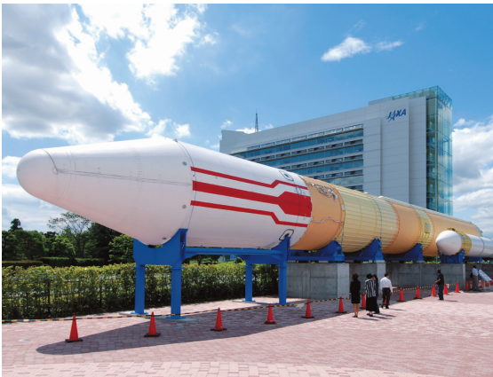
H-IIロケット実機も見どころです

展示室は自由に見学でき、さらに宇宙ステーション試験棟や無重力環境試験棟、宇宙飛行士養成棟をガイド付きで見学する予約制のツアーもあります。また、H-IIロケット実機を常設展示中です。広報・情報棟では、宇宙食などの宇宙グッズも販売しています。