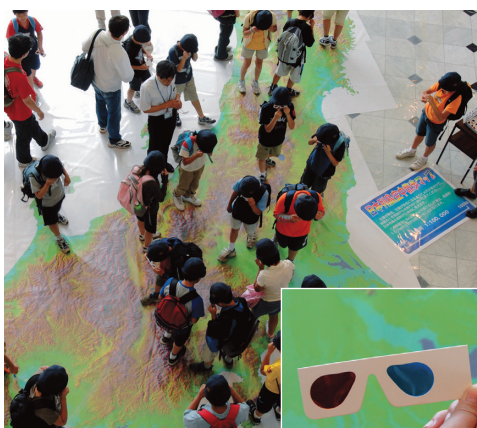
子どもたちもビックリ!

野外の地球広場には、二十万分の一サイズの日本列島球体模型があり、地球上の一秒の実際の長さを自分の足で確かめることができます。また、8/7~10、8/21~24の間に設置される何でも相談室では、地球と測量に関する質問や相談に対応いたしますから、夏休みの宿題に役立ててください。