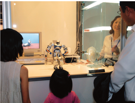
「チョロメテ」に興味津々

館内を案内してくれるツアーガイドもあり、ギネスブックに載つた癒し系アザラシ型ロボット「パロ」に触れることや、鼻腔内の精密モデルを使った内視鏡実演も行っています。