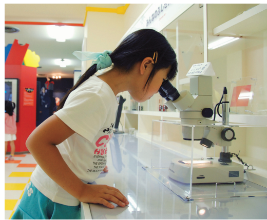
顕微鏡を使っているの見てみよう

実物大H-IIロケットの模型が目印のつくばエキスポセンターは、最新の科学技術や身近な科学に親しめる施設です。子どもたちの夢やあこがれを大切に、体験や遊びを通じて科学の楽しさを伝えられる展示やイベントを行っています。一階の展示場には科学者の仕事を知る「サイエンス・ワークス 科学者のしごと」と、エネルギーに関する五つの部屋を訪ねてスタンプを集める「エネルギーのお城」が新設されました。センターでは、科学教室、サイエンスショー、季節のイベントなどを開催しています。さらに、世界最大級のプラネタリウムも人気です。夏休みにはお子さんと一緒に楽しめる子ども番組や星座番組を上映します。