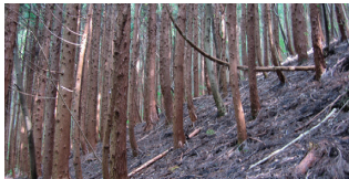
管理放棄され荒廃した森林(下層植生が生育できない状態)

県北地域や筑波山周辺の森林、平地林・里山林などの身近な緑、霞ヶ浦をはじめとする湖沼・河川など、豊かな自然環境を守るために、森林湖沼環境税を導入することになりました。この財源を有効に活用しながら、森林の保全整備や、湖沼などの水質改善のための施策などを積極的に行っていきます。