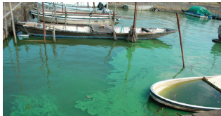
窒素・りんなどの流入により、アオコ(藻類)が大量発生した湖面

豊かな水と緑は、茨城に暮らす私たちにとって大きな魅力であり、大切な財産です。身近な環境である森林や霞ヶ浦をはじめとする湖沼・河川は、水源のかん養、自然災害の防止の役割を果たしています。また、水道用水や農業・工業用水の水源にもなっています。さらには地球温暖化の防止など、県民生活や産業を支えるさまざまな公益的機能を持っています。しかし現状を見ると、管理放棄され荒廃した森林が増加し、また、霞ヶ浦などの湖沼の水質は、汚濁の進行は抑えられているものの、目に見えるほどの大幅な改善には至っていません。 このため、森林や湖沼・河川の果たす公益的機能を十分に発揮できるように、自然環境の保全を行うことを目的に「森林湖沼環境税」を導入することになりました。県民(個人・法人)の皆さまに、広く等しくご負担いただきますようお願いします。