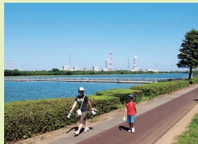
道が直線に長く延びています