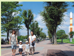
歩きやすい道で、緑も科学も楽しめます

当日は、常陸牛・コシヒカリ・メロンを始め、サツマイモやレンコンなどの県産農産物が並び、試食コーナーも設置。試食されたお客さまからは「甘くておいしい」などの声が聞かれました。