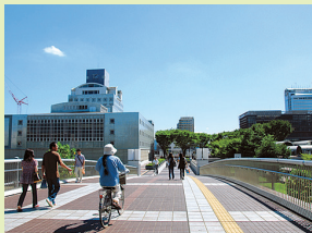
さくら大橋からは、つくばの街が一望できます