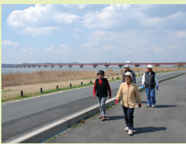
雄大な霞ヶ浦の景色を楽しみながらウォーキング

満開の桜のなか、ふれあいまつりが県三の丸庁舎周辺で開催され、約36,000人の方が来場されました。県産品の展示・販売のほか、いばらき物知りクイズなど、さまざまなイベントが行われました。また、環境に優しいイベントとなるよう、飲食販売では再利用可能な食器が使用されました。