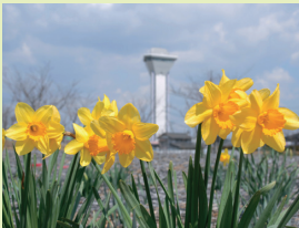
高さ60メートルの虹の塔は、霞ヶ浦ふれあいランドのシンボル