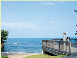
鵜の岬の下に広がる伊師浜海岸は、「日本の白砂青松100選」にも選ばれた美しい海岸