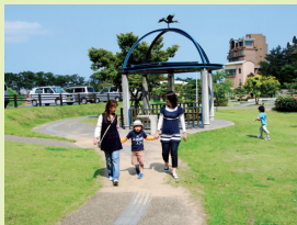
わんぱく岩の周りを歩くコース。遊具が子どもたちに人気です

洞爺湖サミットの主要テーマでもある地球温暖化防止に向け、県民総決起大会が開催されました。大会では、環境功労者表彰などに続き、一般県民、産業・運輸・流通などの団体・企業、市民団体など約450人が「STOP!地球温暖化」県民宣言を読み上げ、温暖化防止を誓いました。