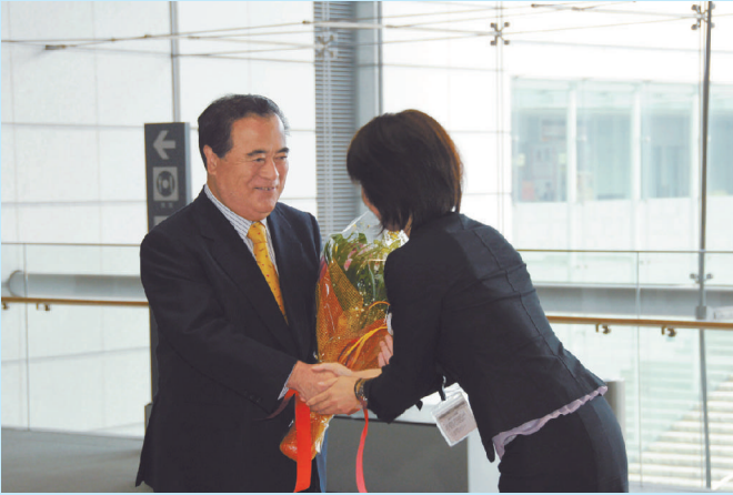
職員から花束を受け取る橋本知事