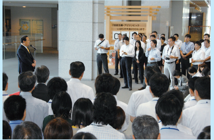
出迎えた県民や職員を前にあいさつする橋本知事