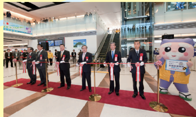
オープニングセレモニー

茨城⇄ソウル便のほか、4月16日(金)からは茨城⇄神戸の定期便が就航します。また、ゴールデンウィーク中には、グアムや上海など各方面へのチャーター便も予定されていますので、ぜひ茨城空港をご利用ください。