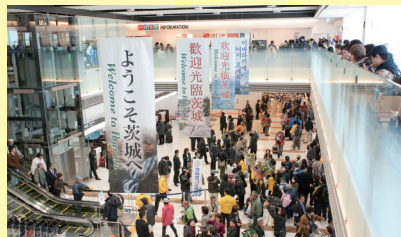
大勢の人でにぎわうターミナルビル