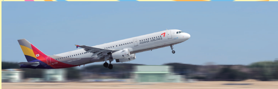
茨城空港から飛び立つアジアナ機