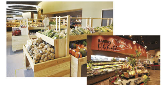
▲地場産品の販売などによる地域活性化(しもつま)