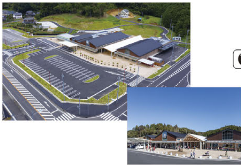
▲駐車場など休憩施設の整備(かさま)

また、道の駅の整備・運営主体である市町村に対し、助言や情報提供等の支援を行っています。