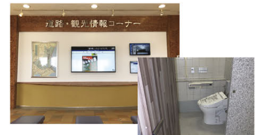
▲充実した情報提供や洋式トイレなど利用者に配慮した施設(いたこ)