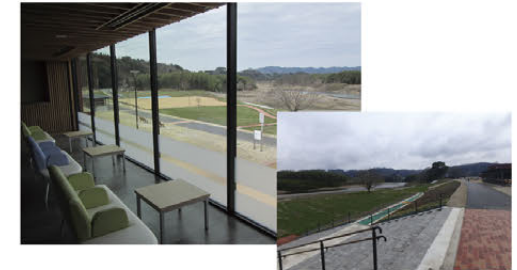
▲隣接する河川への眺望を活かした親水空間の整備(常陸大宮)