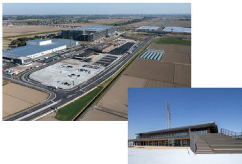
▲周辺民間施設と連携した新たなまちづくりの拠点(常総)