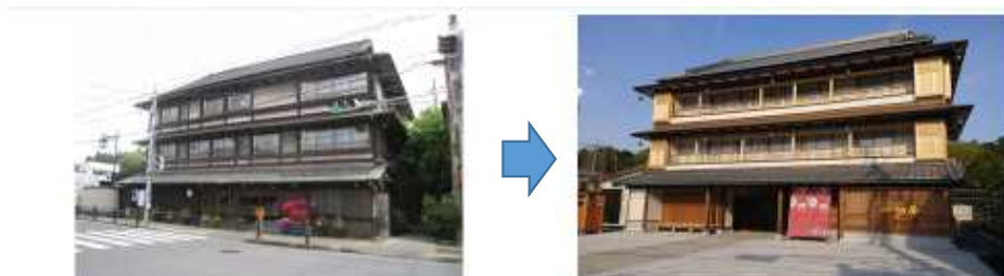
東日本大震災を機に廃業となった旅館を、市が観光インフォメーション等の施設として活用