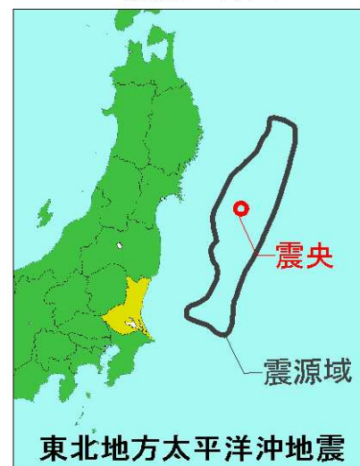
東北地方太平洋沖地震