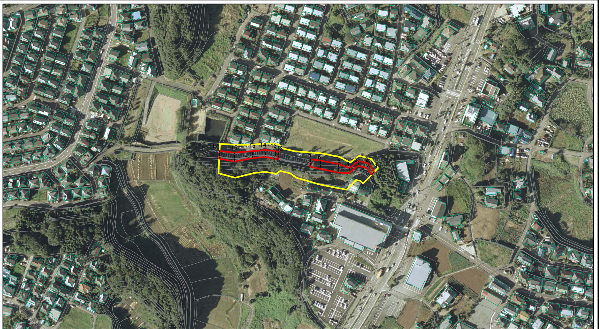
図中の数字は横断測線番号を示す