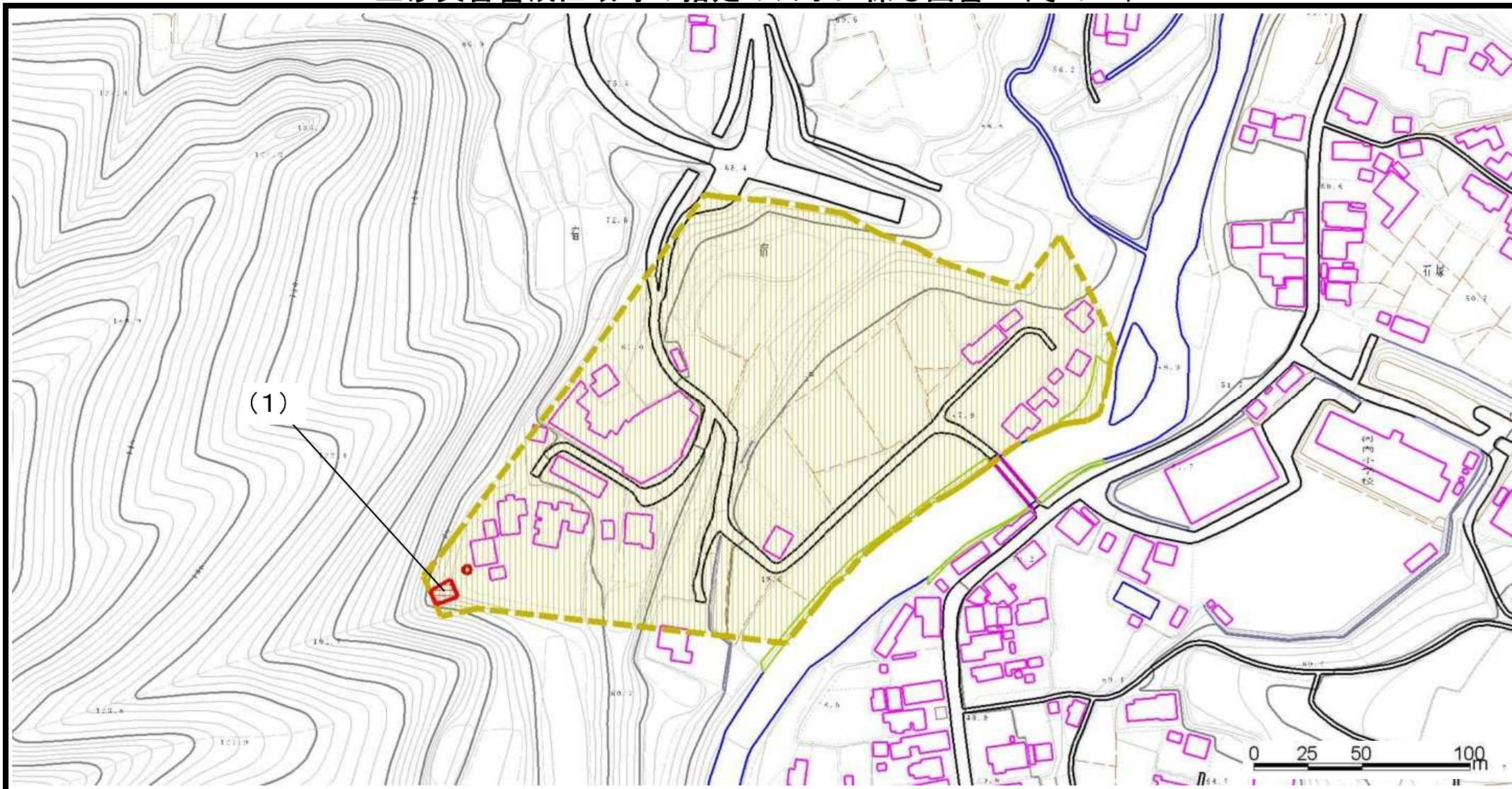
様式-2(土) 土砂災害警戒区域・土砂災害特別警戒区域 区域図(その1)