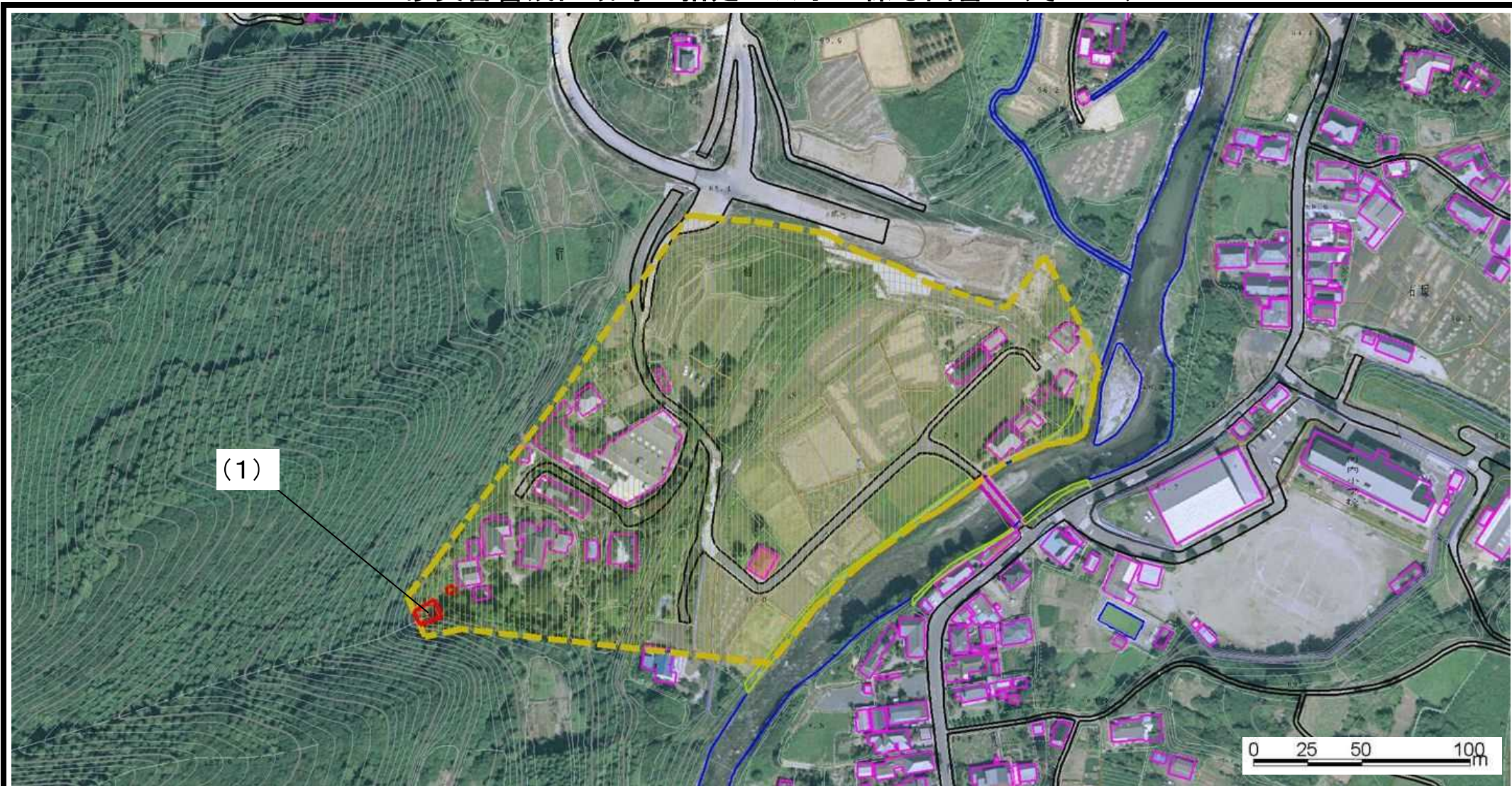
様式-2(土) 土砂災害警戒区域・土砂災害特別警戒区域 区域図(その1)