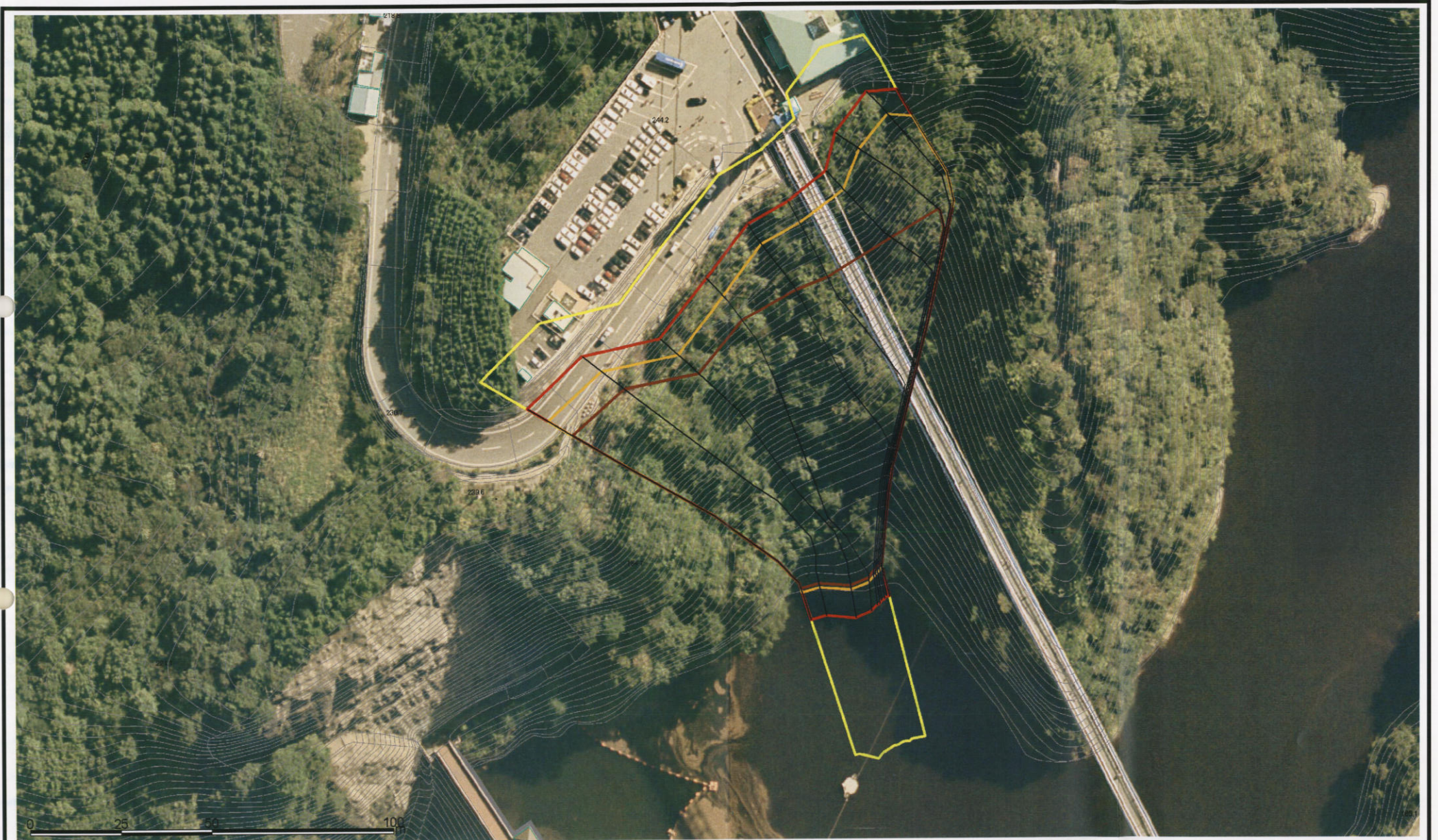
様式-3(急) 土砂災害警戒区域・土砂災害特別警戒区域 区域図(その2)