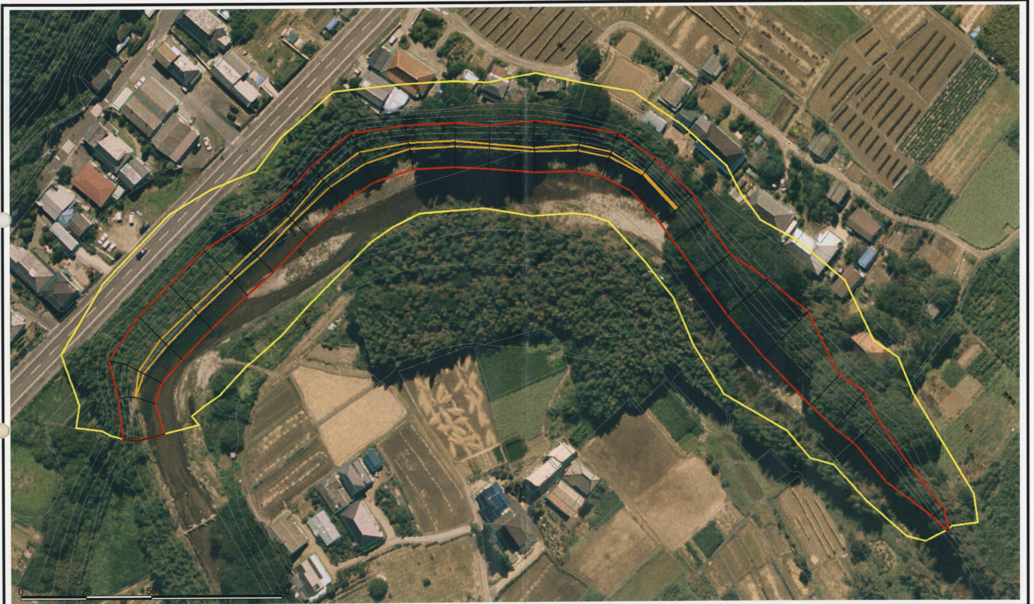
様式-3(急) 土砂災害警戒区域・土砂災害特別警戒区域 区域図(その2)