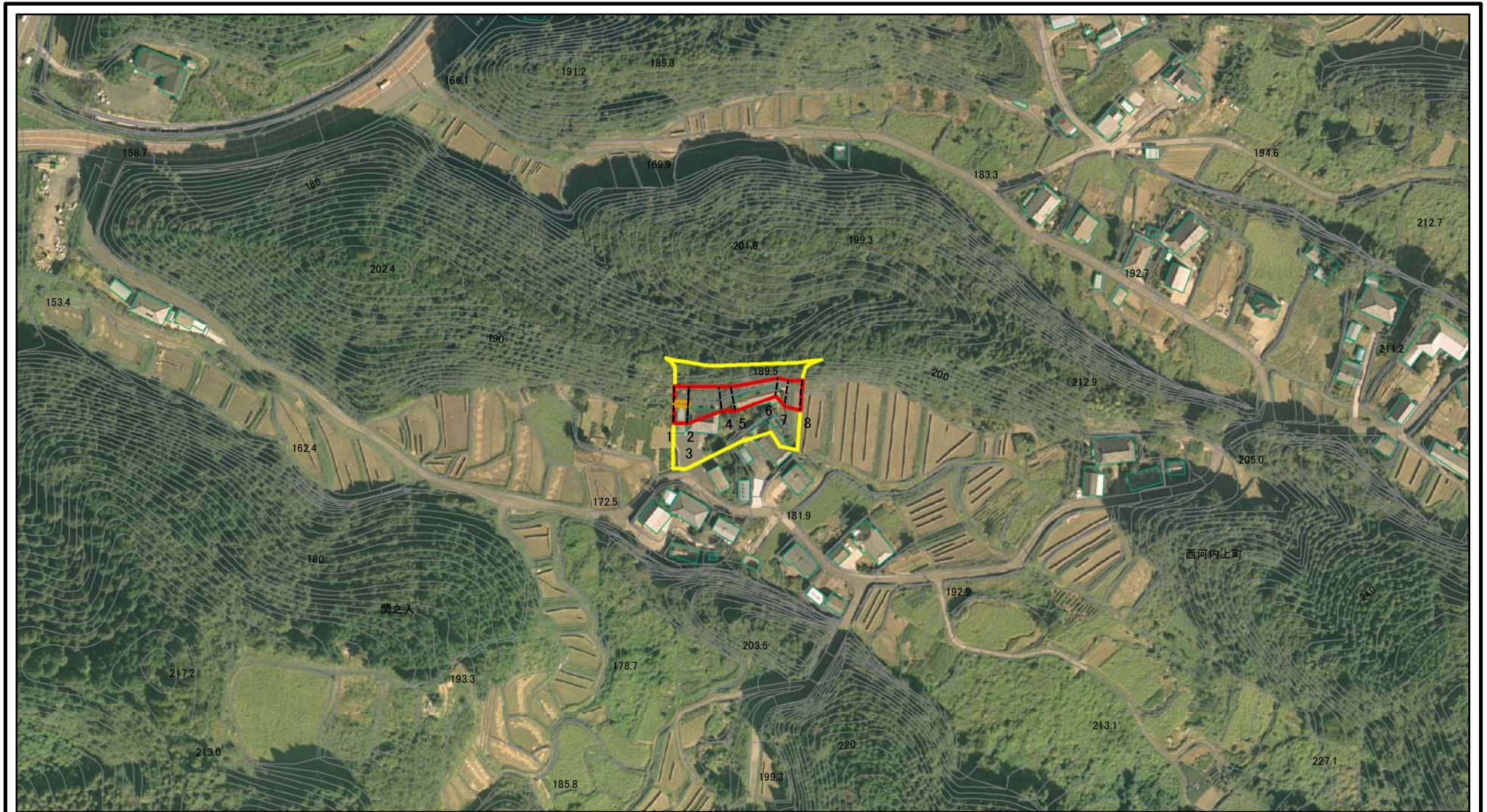
図中の数字は横断測線番号を示す