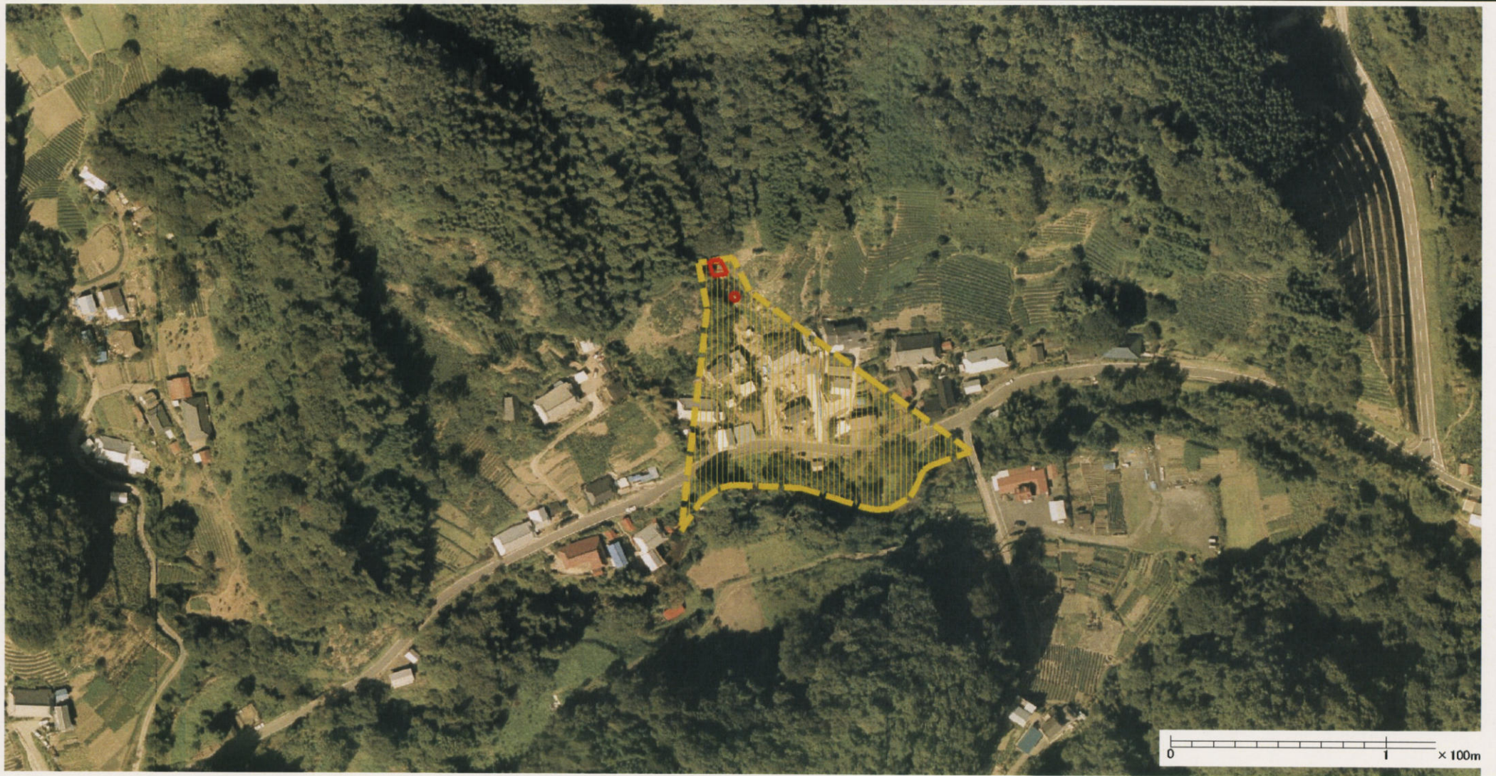
様式-3 (土) 土砂災害警戒区域・土砂災害特別警戒区域 区分図 (その2)