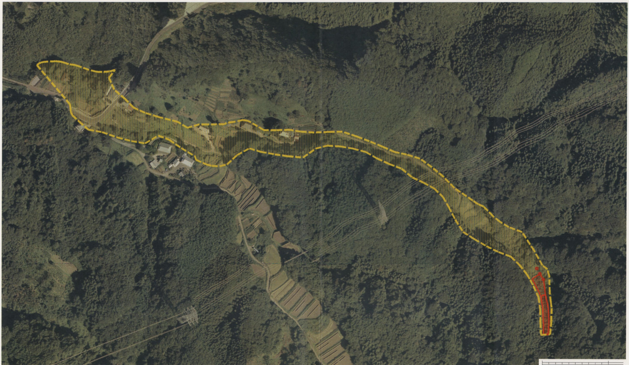
様式-3 (土) 土砂災害警戒区域・土砂災害特別警戒区域 区分図 (その3)