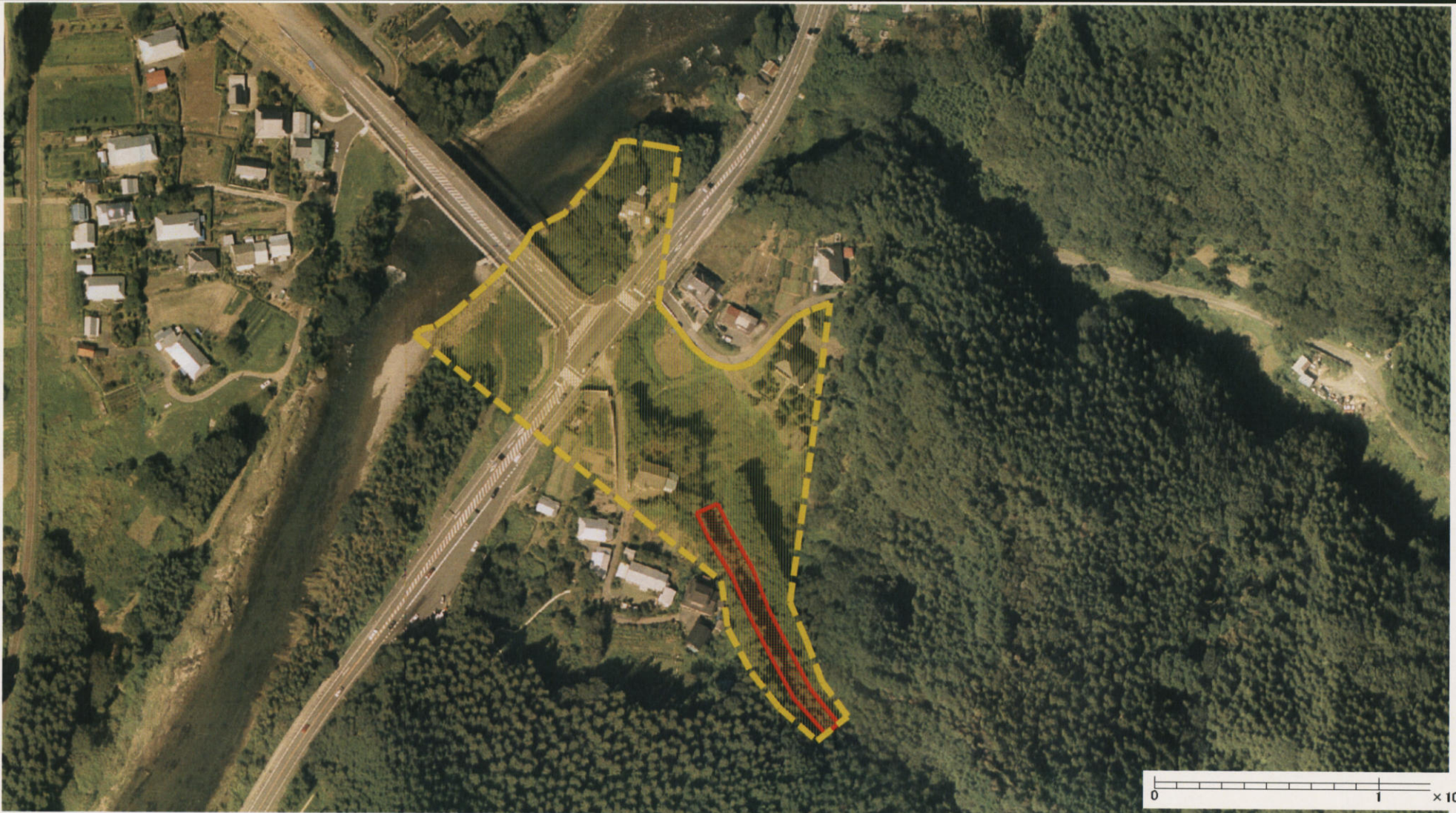
様式-3 (土) 土砂災害警戒区域・土砂災害特別警戒区域 区分図 (その2)