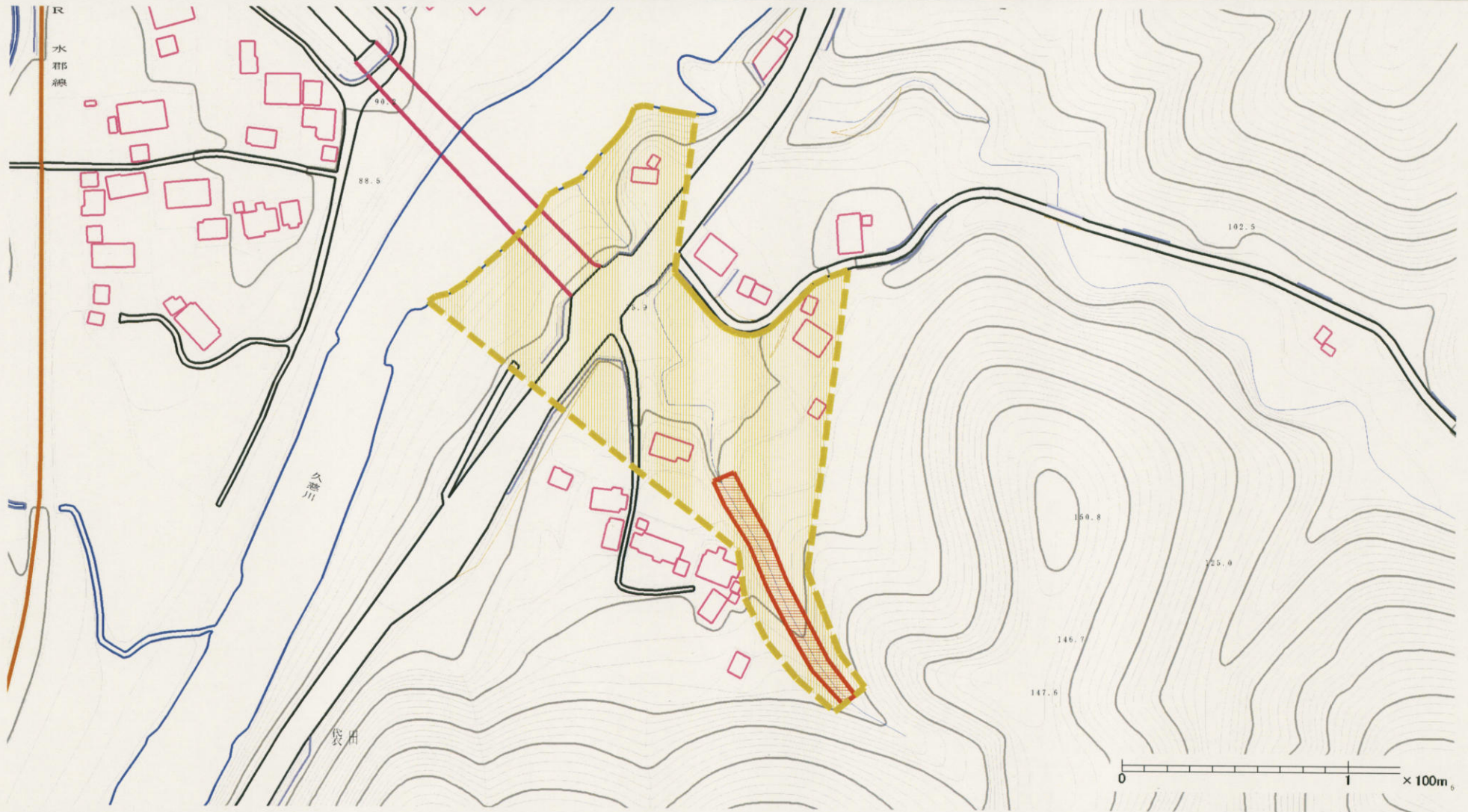
様式-2 (土) 土砂災害警戒区域・土砂災害特別警戒区域 区分図 (その1)