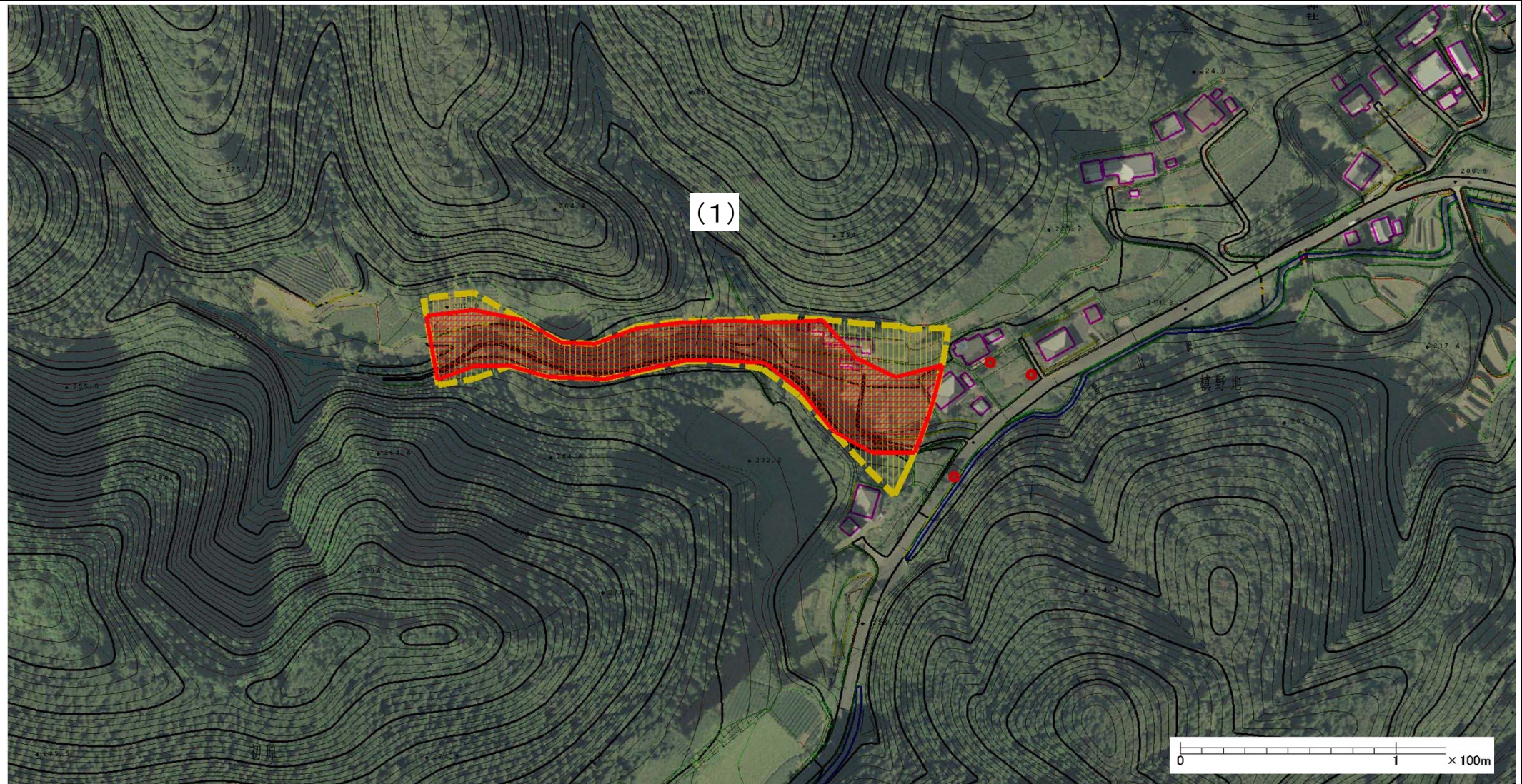
様式-2(土) 土砂災害警戒区域・土砂災害特別警戒区域 区域図(その1)