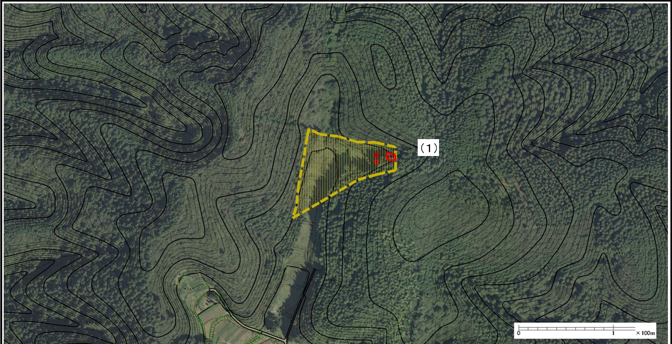
様式-2(土) 土砂災害警戒区域・土砂災害特別警戒区域 区域図(その1)