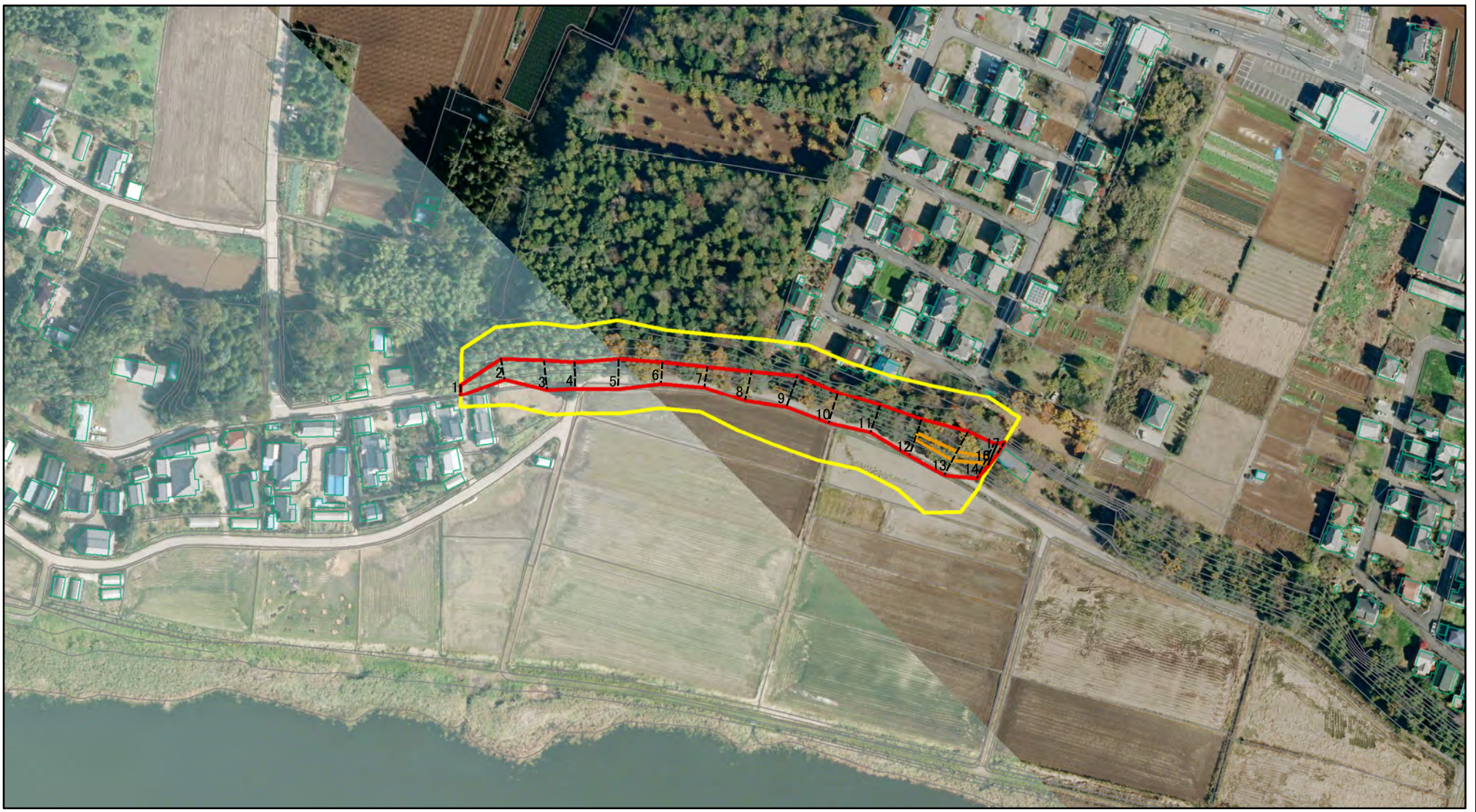
図中の数字は横断測線番号を示す