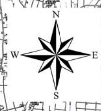
利根川水系八間堀川 洪水浸水想定区域図 (家屋倒壊等氾濫想定区域(氾濫流))