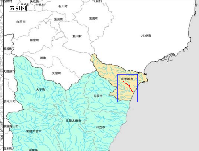
大北川水系花園川 洪水浸水想定区域図 (家屋倒壊等氾濫想定区域 (氾濫流))