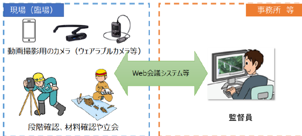
図 2-1 機器構成 (例)