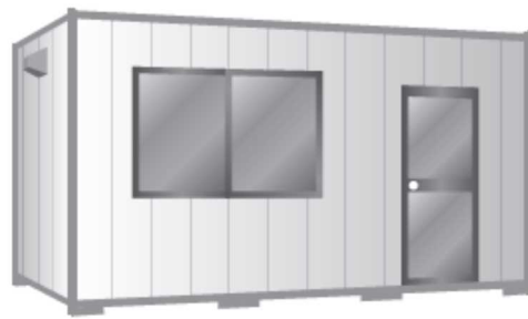
プレハブ・ユニットハウス