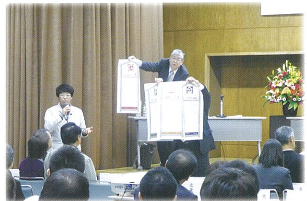
「まち自慢」の取り組みの紹介

また、当日はまちづくりに多大な貢献があった団体等を表彰する「茨城県うるおいのあるまちづくり顕彰事業」の表彰式も併せて行なわれ、まちづくりグリーンリボン賞については5件、まちづくりグッドサイン賞については1件が表彰されました。