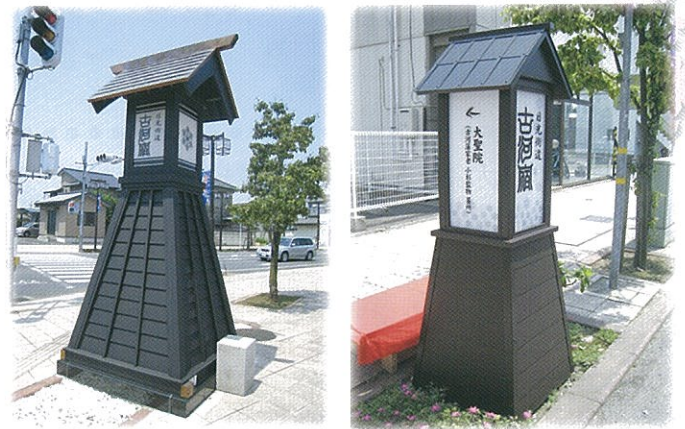
観光サイン設置事業