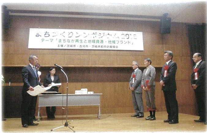
茨城県うらおいのあるまちづくり顕彰事業表彰式