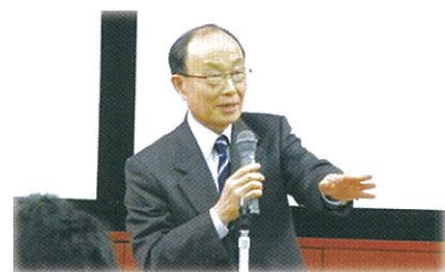
低炭素まちづくり講演会

の3点を指摘し, 学会でとりまとめた「低炭素都市づくりガイドブック(素案)」に基づき, 地区・街区レベルにおける低炭素化の考え方や集約型都市形成アクションプランの策定等について, 詳細な解説がなされました。