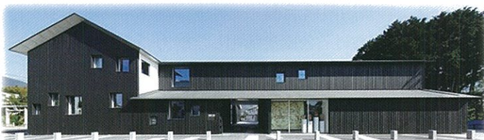
真壁伝承館の建設事業