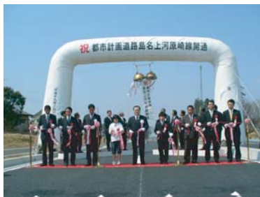
島名上河原崎線開通式

島名上河原崎線の開通式が平成19年3月28日に行われました。また、道路開通式とあわせて記念植樹も行われました。