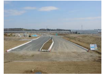
島名上河原崎線と駅周辺