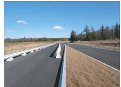
島名上河原崎線工事状況(3月)