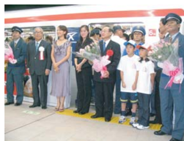
つくばエクスプレス開業

平成17年8月24日、午前5時7分、全線で最初となる始発電車、つくば発秋葉原行き区間快速が、満員の乗客を乗せて出発しました。開業1週間で105万人の乗降客となり、多くの人びとが沿線地域を訪れました。