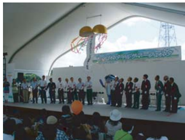
開業1周年イベント

平成17年8月のつくばエクスプレスの開業から1年が経過し、万博記念公園駅前においても建物の建築が進んできました。 8月19日～20日には、万博記念公園駅前で開業1周年イベントが開催されました。