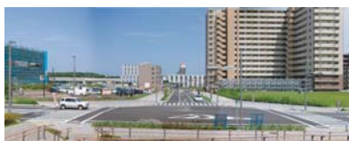
駅西口周辺状況(7月)