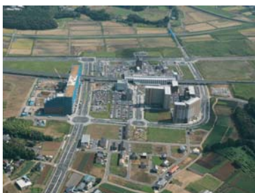
駅周辺を上空から撮影(9月)

つくばエクスプレスの開業から約3年が経ち、駅周辺を中心として住宅やマンションが建設され、街なみが形成されつつあります。