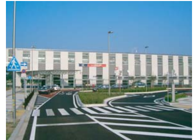
開業されたTX万博記念公園駅の様子

平成17年8月24日、午前5時7分、全線で最初となる始発電車、つくば発秋葉原行き区間快速が、満員の乗客を乗せて出発しました。開業1週間で105万人の乗降客となり、多くの人びとが沿線地域を訪れました。