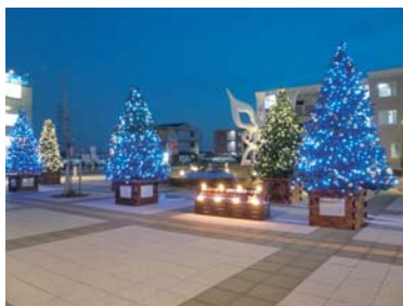
駅前にイルミネーションが点灯

平成19年12月8日に、～ぬくもり感じるあたたかまちづくり～を目指し、「みんなのほっと！ 駅前イルミネーション」の点灯式が行われました。