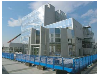
移転先のウィンズヒル

平成18年3月20日に、より地域に密着した対応が行えるように、茨城県県南都市建設事務所（現：茨城県つくばまちづくりセンター）が、万博記念公園駅西口に完成したウィンズヒルへ移転しました。