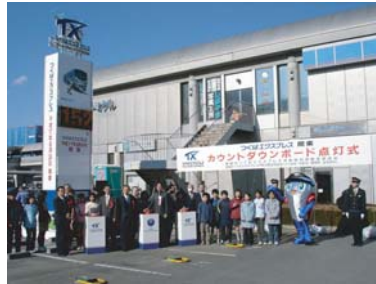
カウントダウンボード点灯式典

平成17年3月25日、TXつくば駅前では、「カウントダウンボード点灯式典」が行われ、カウントダウンボードに開業までの残り日数が点灯されました。TXマスコットキャラクターの「スピーフィ」も参加して、盛大な式典となりました。