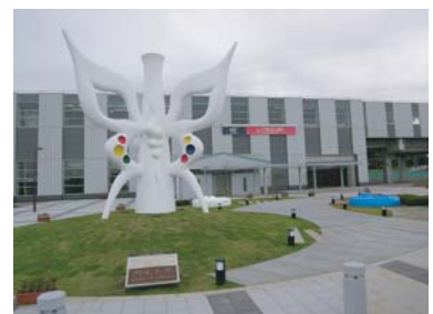
科学万博記念公園から東口駅前広場に岡本太郎氏作「みらいを視る」が移設されました