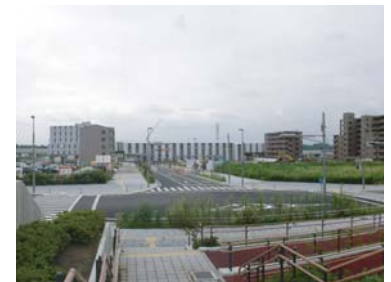
駅西口周辺状況(8月)