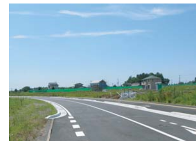
使用収益が開始された一般住宅地(4月)