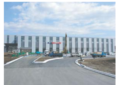
西口駅前広場工事状況

つくばエクスプレス沿線のまちづくりの魅力を首都圏に広くPRしていくため、茨城県とUR都市再生機構は地域の皆様との意見交換に基づき各地区の愛称を決定しました。