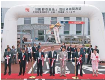
「田園都市島名」道路開通式

「田園都市島名」の駅周辺の県道と市道の開通式が平成17年8月12日に、万博記念公園駅の西口で行われました。また、開通式とあわせて記念植樹も行われました。