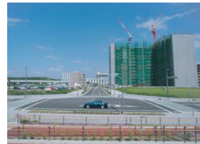
駅西口周辺状況(6月)