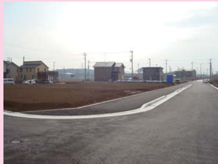
① 島名環状線北側の一般宅地の様子