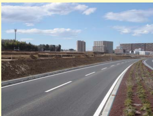
③ 新都市中央通り線沿い(地区中央)の宅地整形工事の様子