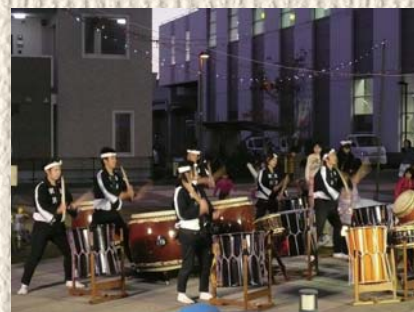
樹波による和太鼓の演奏