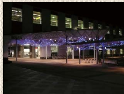
駅西口イルミネーション