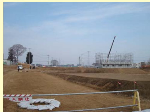
② コミュニティ道路の工事の様子