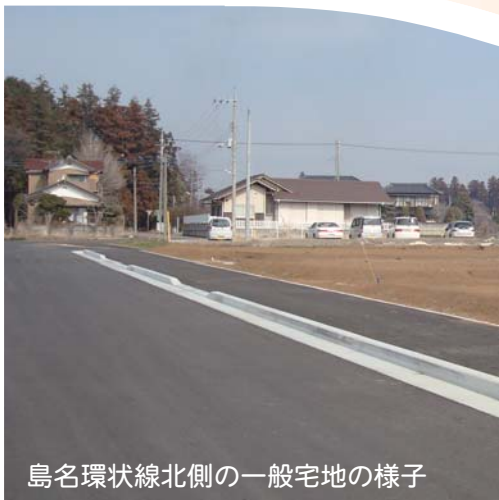
島名環状線北側の一般宅地の様子