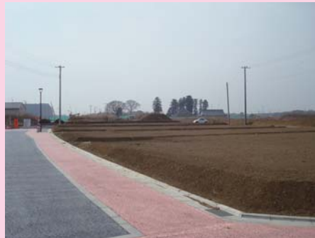
② 島名環状線内の一般宅地の様子