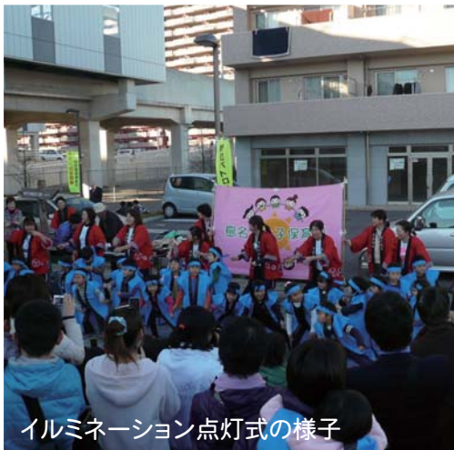
イルミネーション点灯式の様子