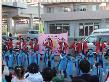
島名杉の子保育園アトラクション