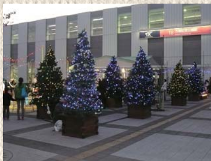
駅東口イルミネーション