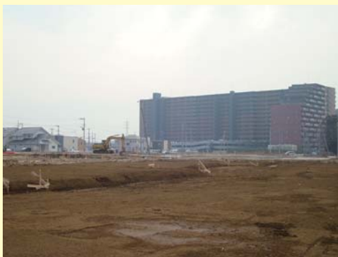
① 島名環状線沿いの宅地整形工事の様子