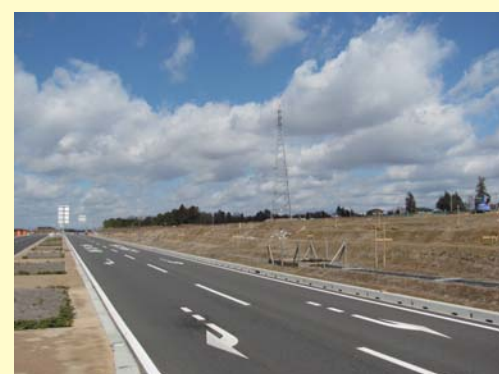
④ 新都市中央通り線沿い(地区南部)の宅地整形工事の様子