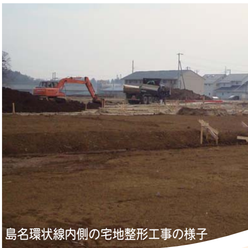
島名環状線内側の宅地整形工事の様子