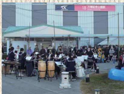
高山中学校吹奏楽部による演奏